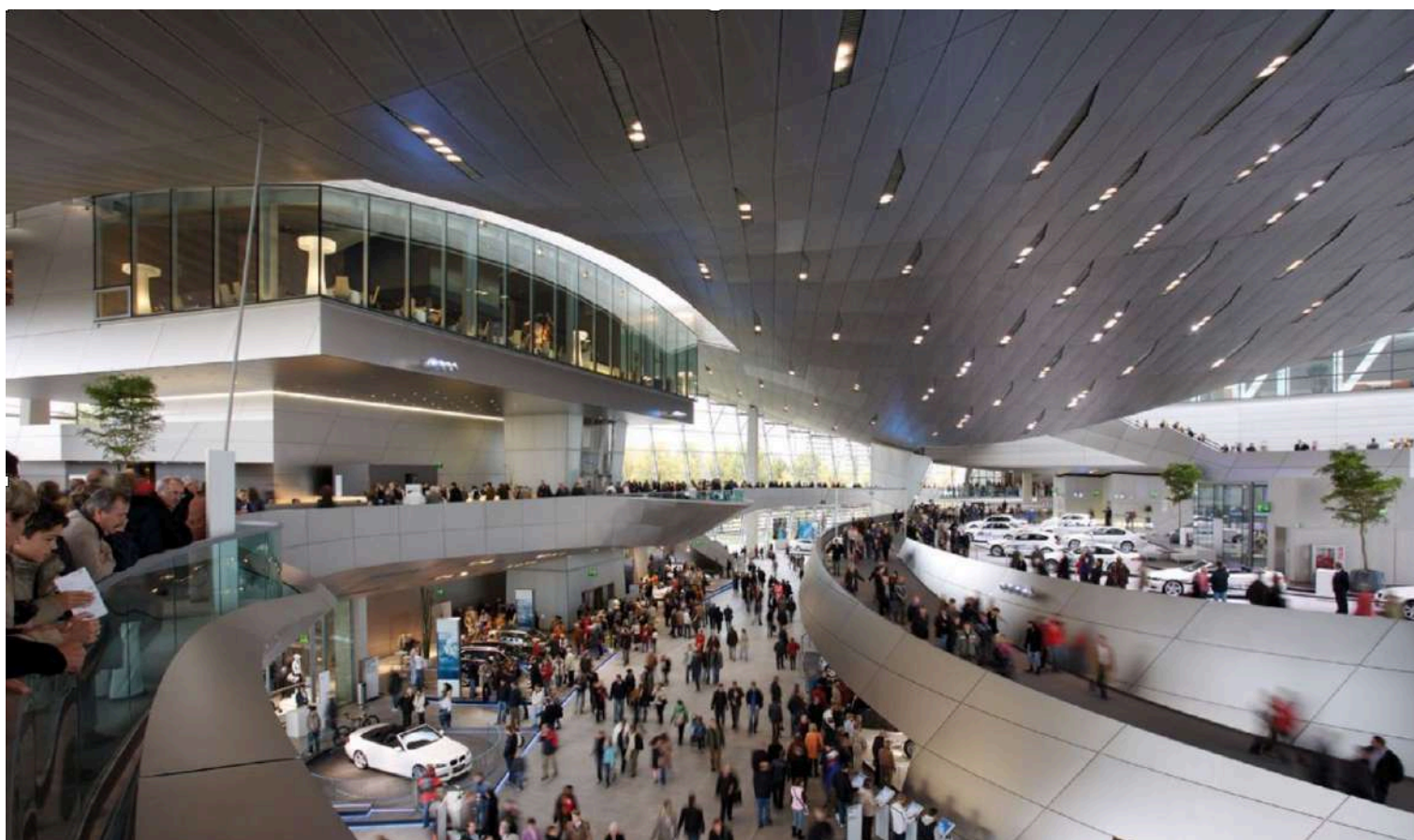
BMW Welt - Vista Interna

BMW Welt abriu suas portas em 20 de outubro de 2007, o culminar de anos de planejamento. Depois que a decisão de construir o BMW Welt foi aprovada no final da década de 1990, a próxima questão cadente era escolher um local adequado. Ficou claro que o novo centro de eventos e entregas deveria ser construído em um local repleto de história, próximo aos edifícios atuais da BMW.