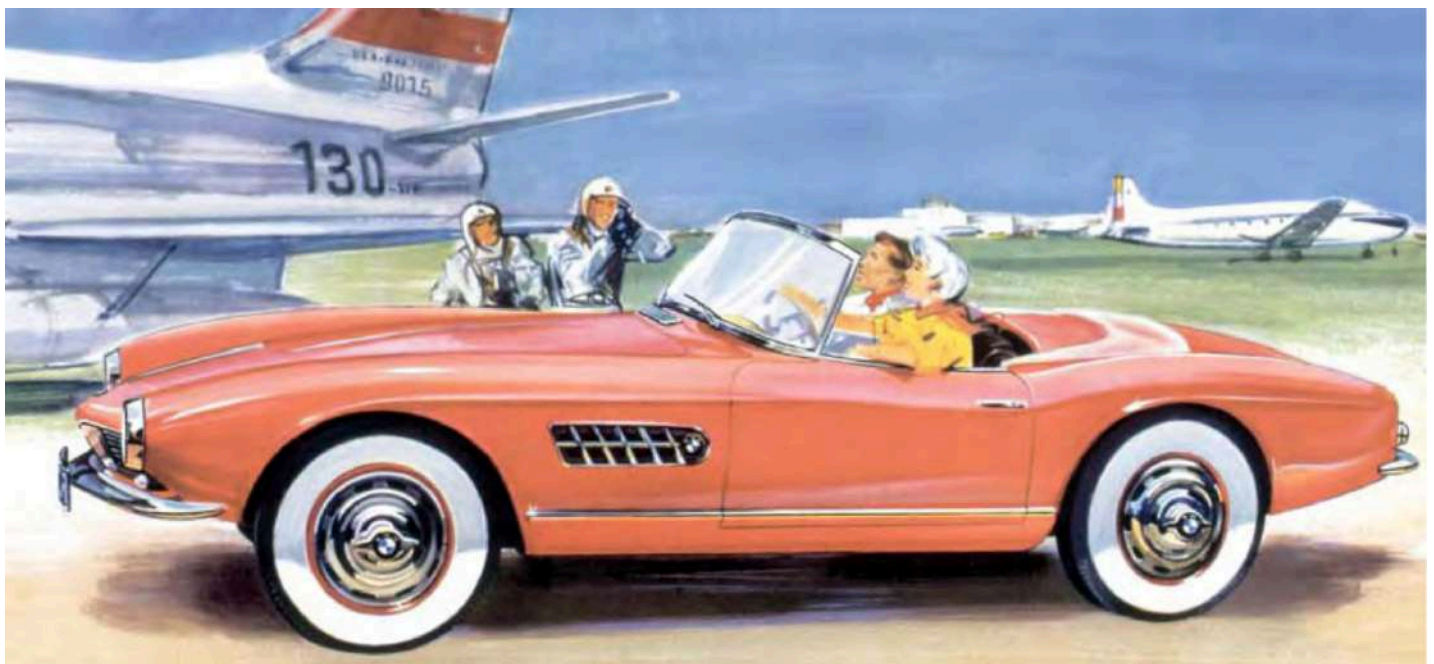
BMW 507 V8 - Catálogo de vendas