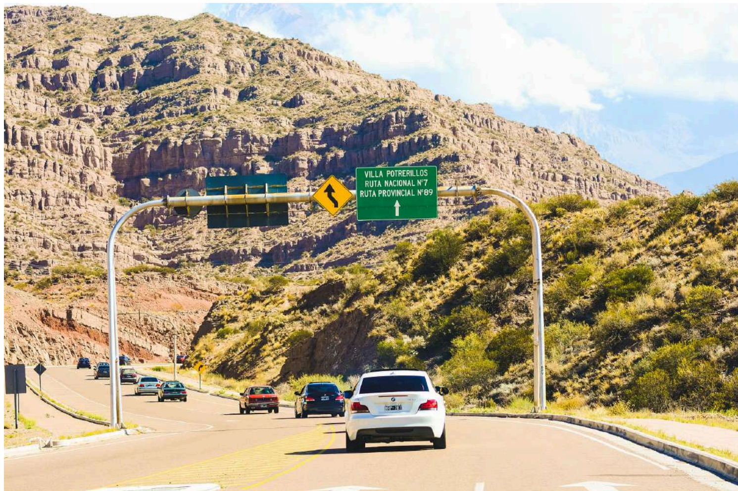
BMW Auto Club Mendoza - Passeio a Potrerillos - Abril 2018

É um dos BMW Clubs mais ativos da América Latina e seus entusiastas contam com belos modelos clássicos.