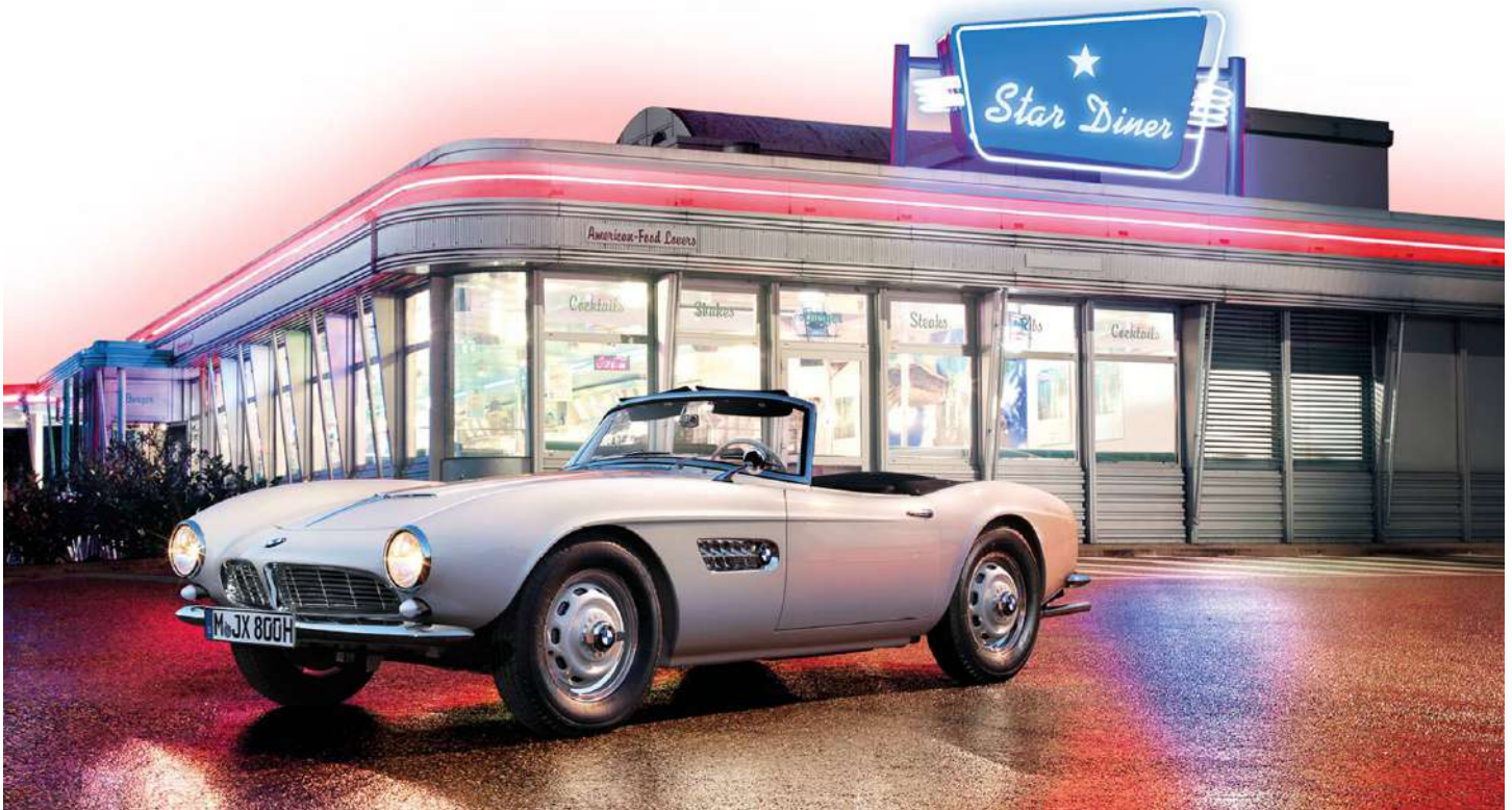
Elvis Presley's BMW 507 V8 completamente restaurado