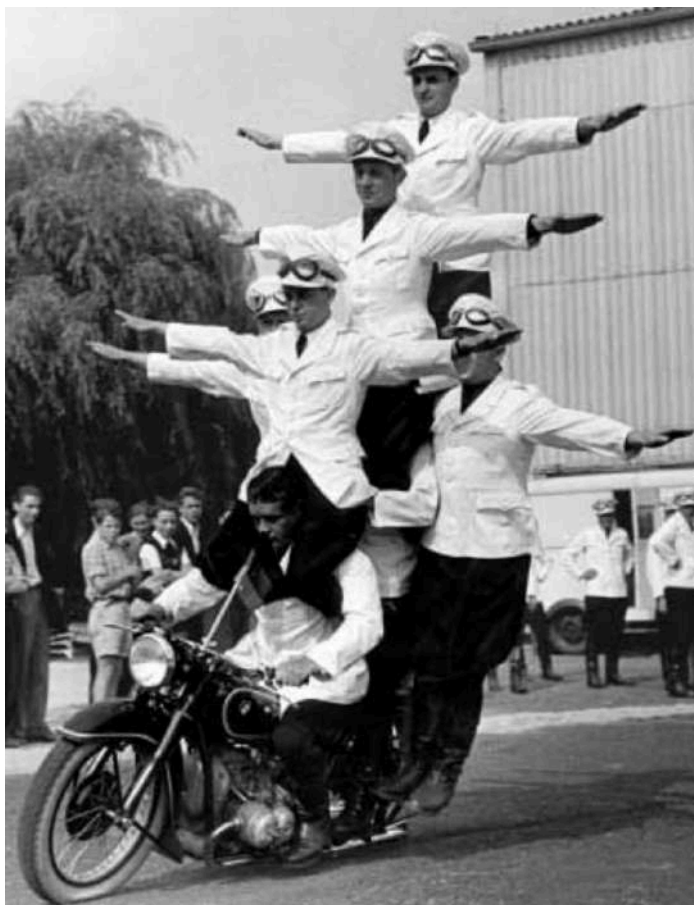
BMW Motorrad em equilíbrio