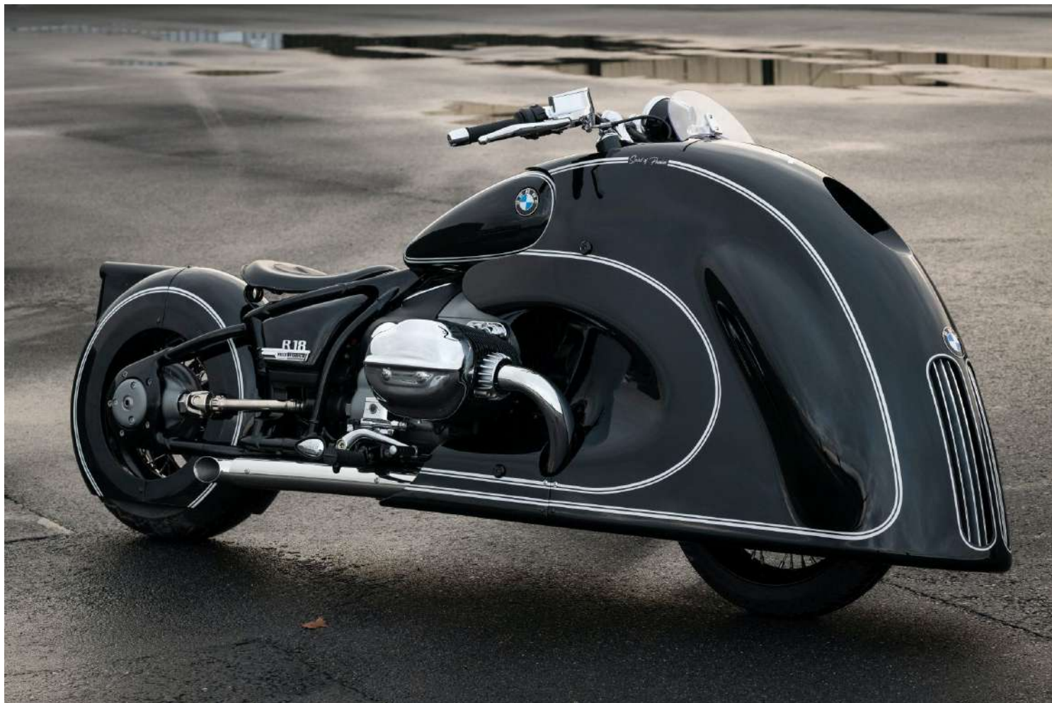
BMW R18 Custom Bike

É uma obra de arte sobre duas rodas e chama muito a atenção lembrando o design retrô dos anos 30 e a grade em forma de rim do BMW 328.