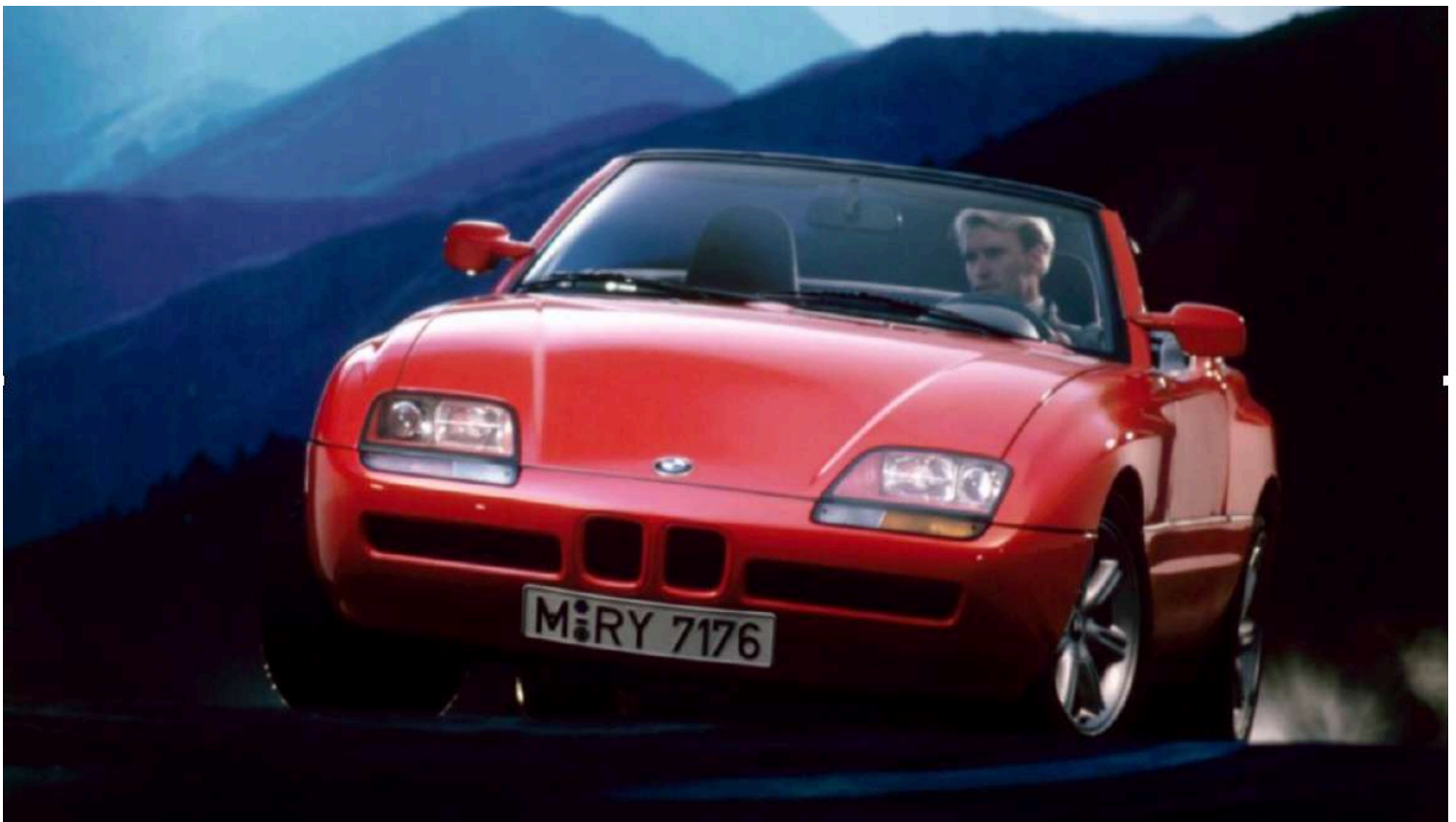
BMW Z1 E30/Z - Catálogo de vendas