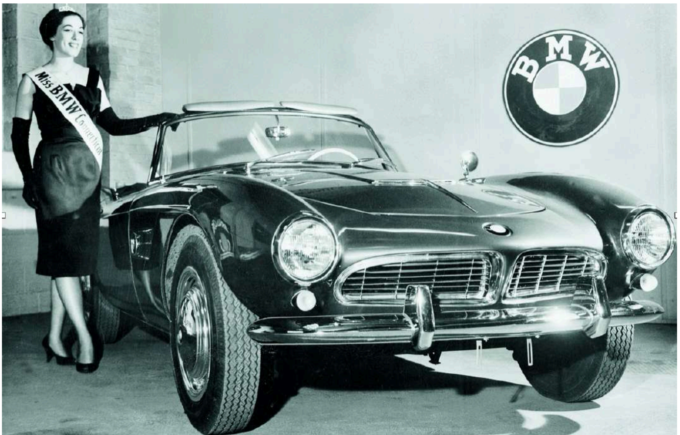
BMW 507 V8 e a Miss BMW