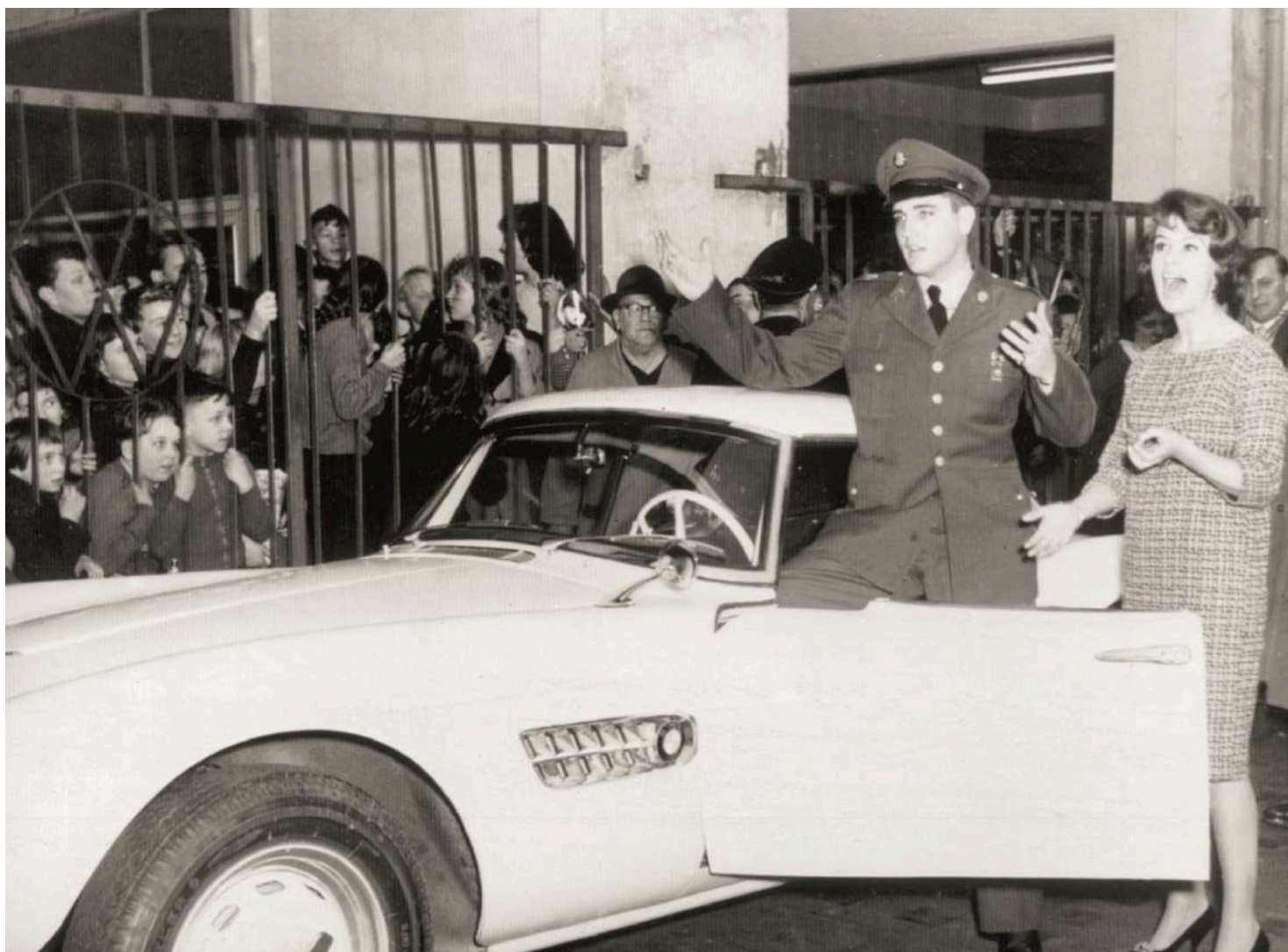
Elvis Presley's BMW 507 V8

A foto histórica abaixo immortalizou este modelo, que foi adquirido recentemente pela BMW nos EUA e totalmente restaurado pela fábrica em sua cor branca original.