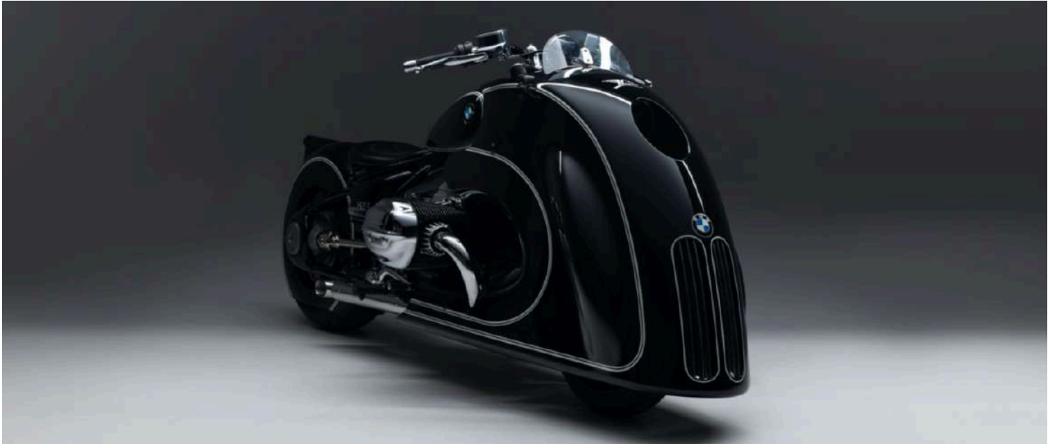
BMW R18 Custom Bike