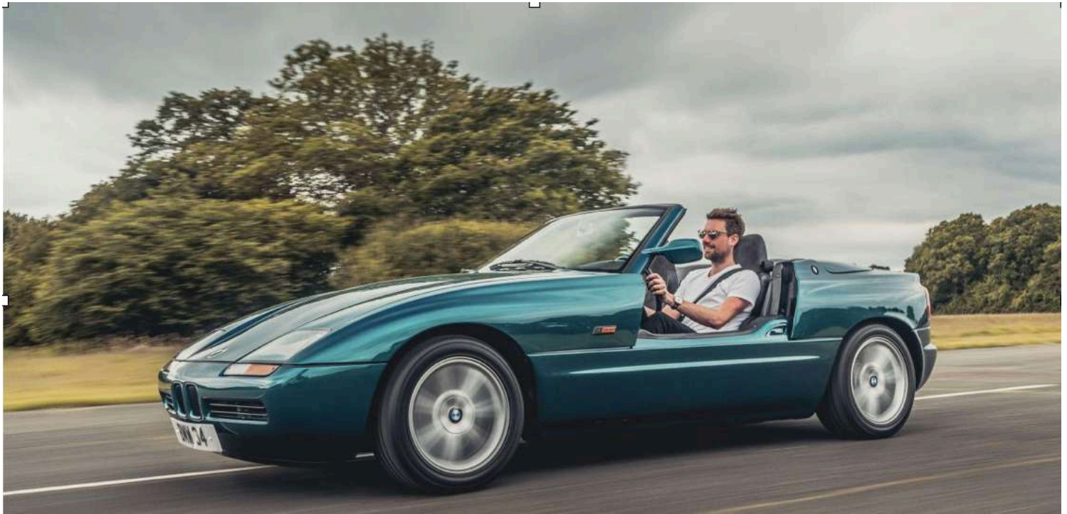
BMW Z1 E30/Z - Portas abaixo