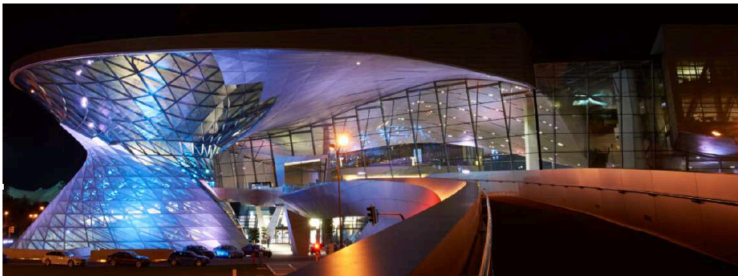
BMW Welt - Vista Frontal

Na BMW Welt, um ambiente de trabalho seguro é fornecido para funcionários e parceiros que promovem saúde e excelência. Além disso, por ser um local público, eles também levam muito a sério a responsabilidade pelos visitantes e se esforçam para oferecer uma experiência segura e ecológica aos visitantes até o último detalhe.