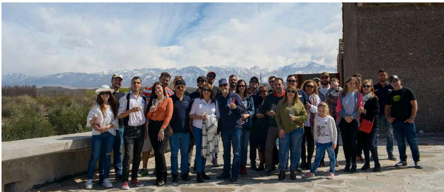
BMW Auto Club Mendoza - Encontro Setembro 2019

Planejar reuniões, caminhadas, passeios e outros eventos.