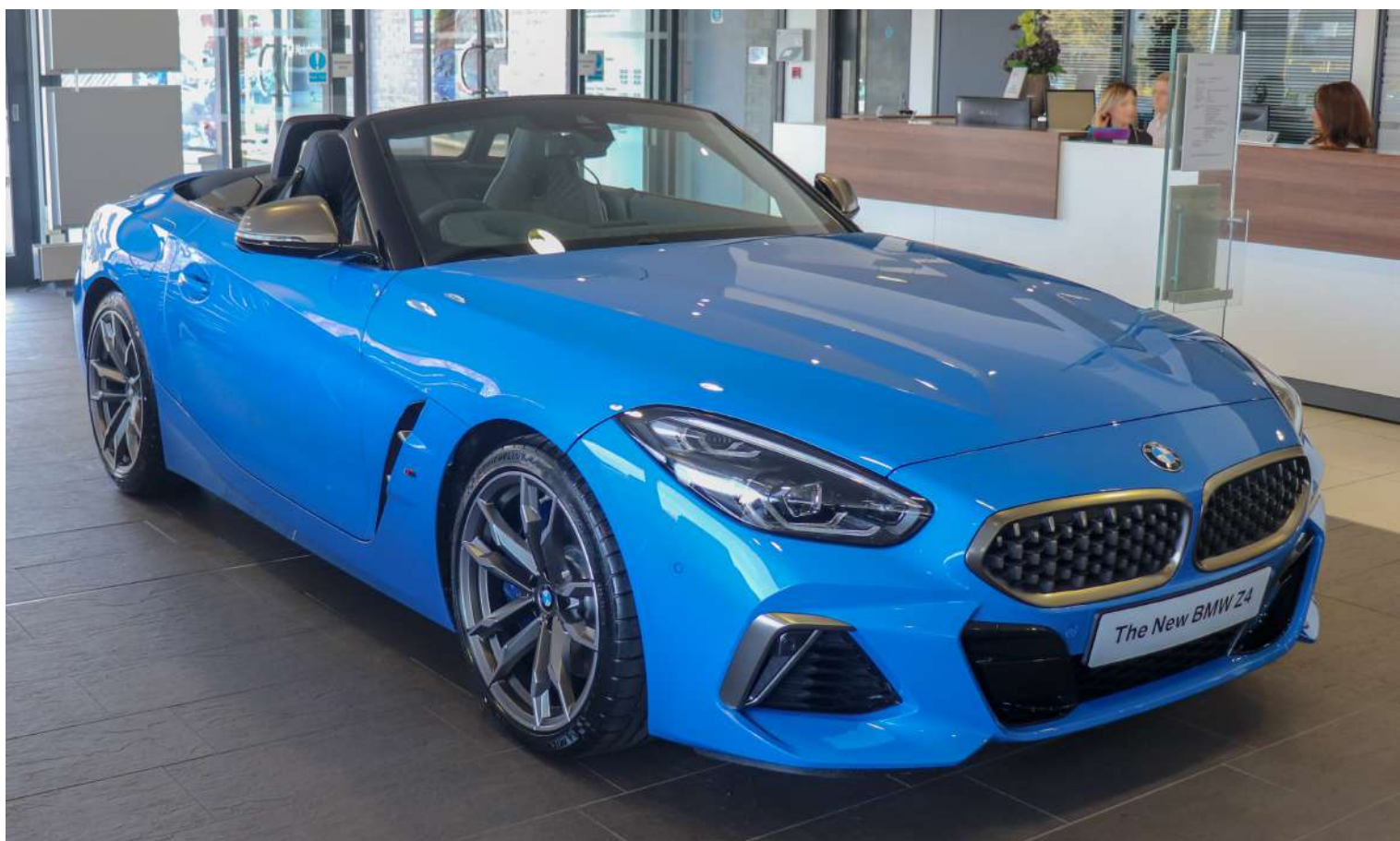
BMW Z4 G29 M40i 382 HP's Misano Blue

Os modelos sDrive são movidos pelo motor B48 de 4 cilindros em linha de 2.0 litros, enquanto o M40i é movido pelo motor B58 de 6 cilindros em linha. Todos os motores vêm com indução forçada e estão acoplados a uma transmissão automática de 8 velocidades.