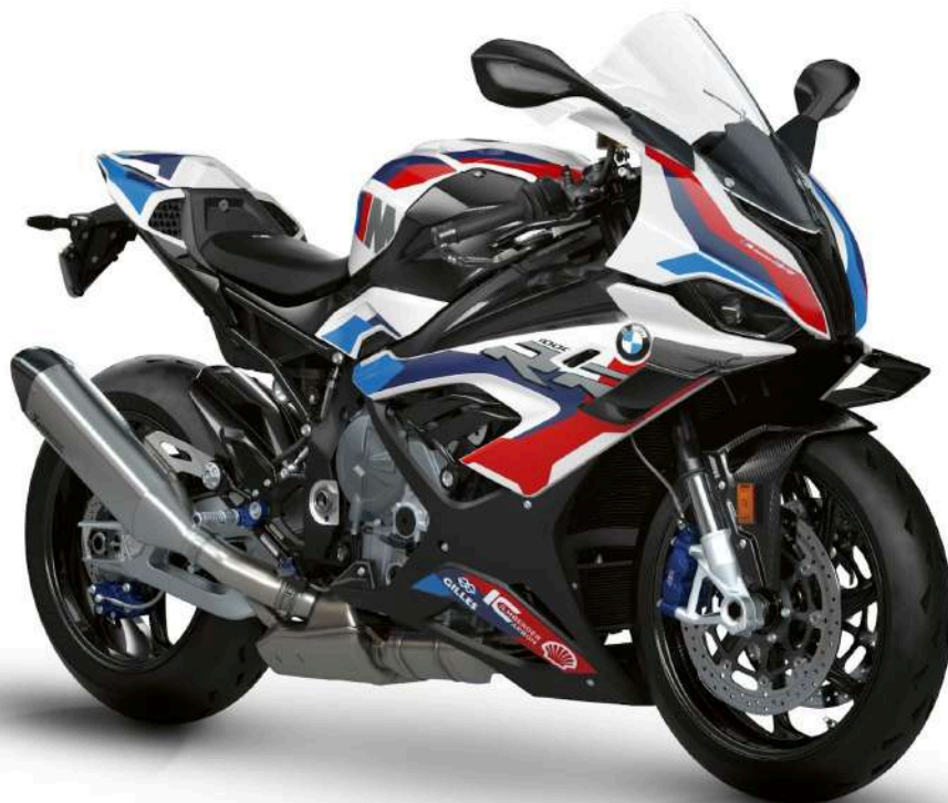
BMW M 1000 RR