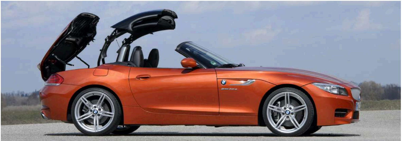
BMW Z4 E89 M3.5IS 3.0 LN54 382 HP's Valencia Orange