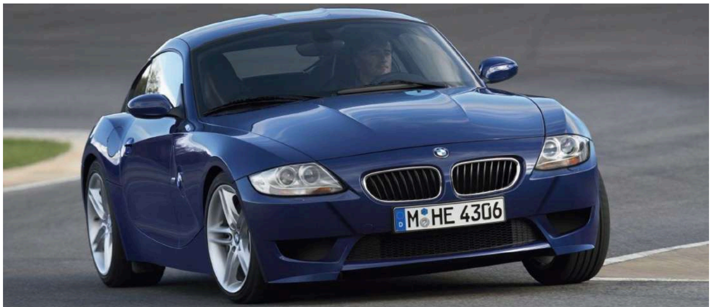
BMW Z4 M Coupe E86 343 HP's