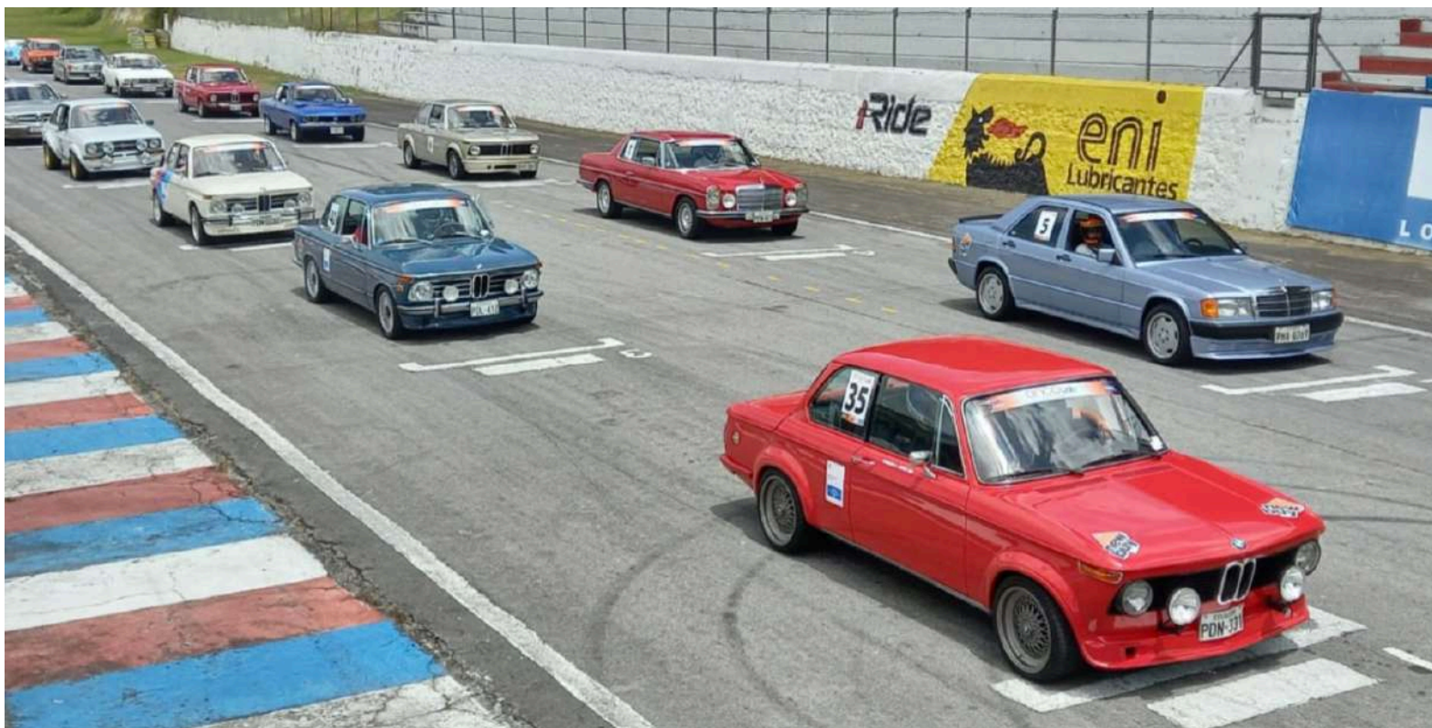
BMW Auto Club Ecuador - Autódromo Yahuarcocha Ybarra - Agosto 2021

Em agosto de 2018, na Convenção de Cusco Peru, o BMW Auto Club Equador recebeu por parte da BMWCLAF o Prêmio de Menção Honrosa Anual, na categoria Car Club, por suas relevantes atividades.