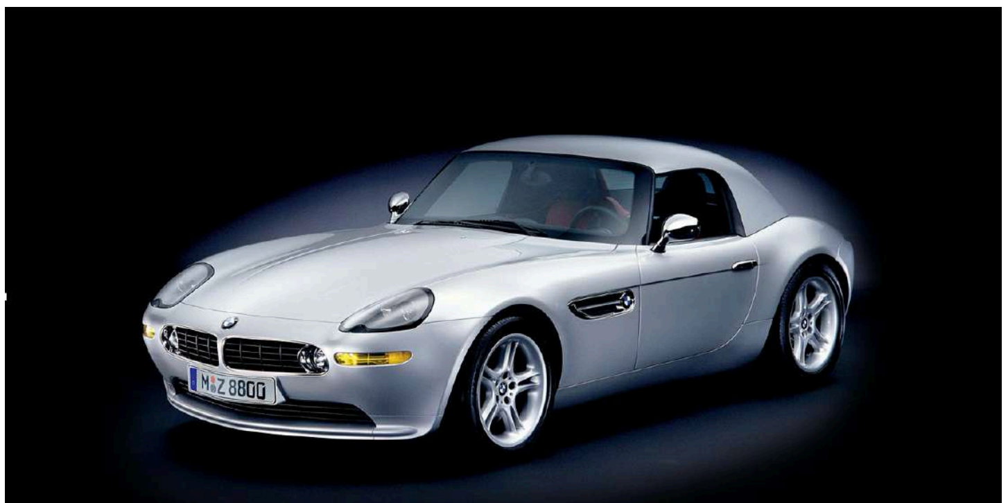
BMW Z8 Roadster E52 395 HP's com Capota Dura