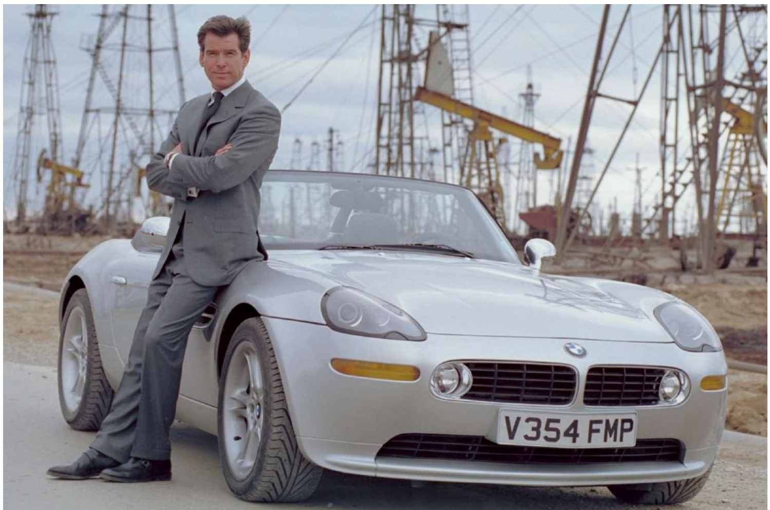
BMW Z8 Roadster E52 - James Bond 007

Depois do 328 e do 507, é o BMW Roadster mais desejado de todos os tempos.