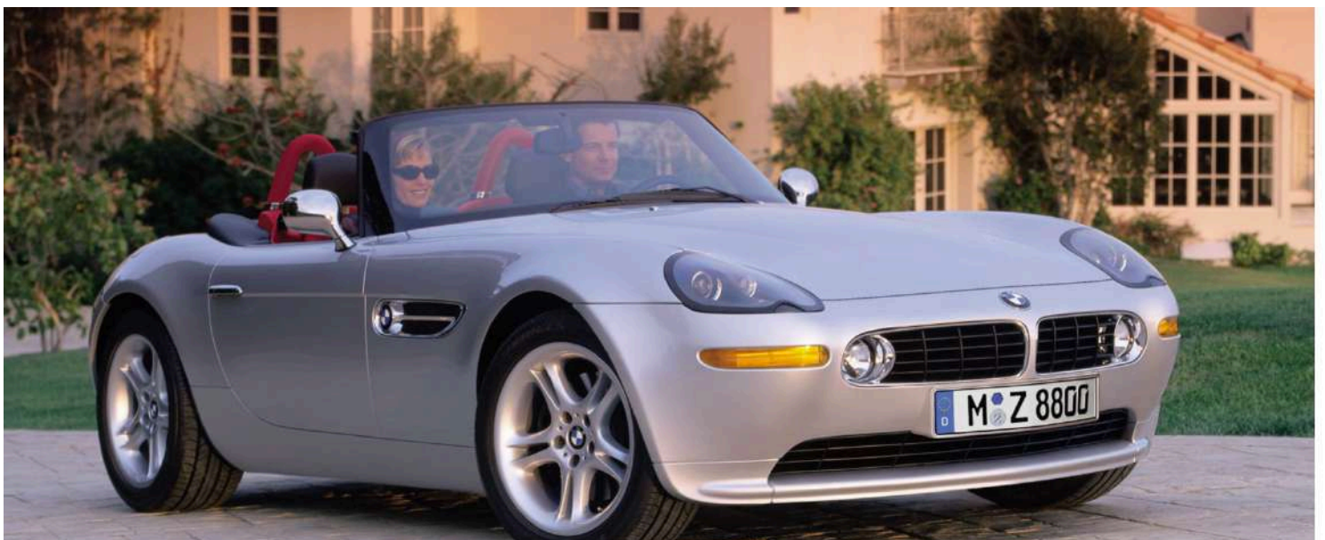
BMW Z8 Roadster E52 395 HP's