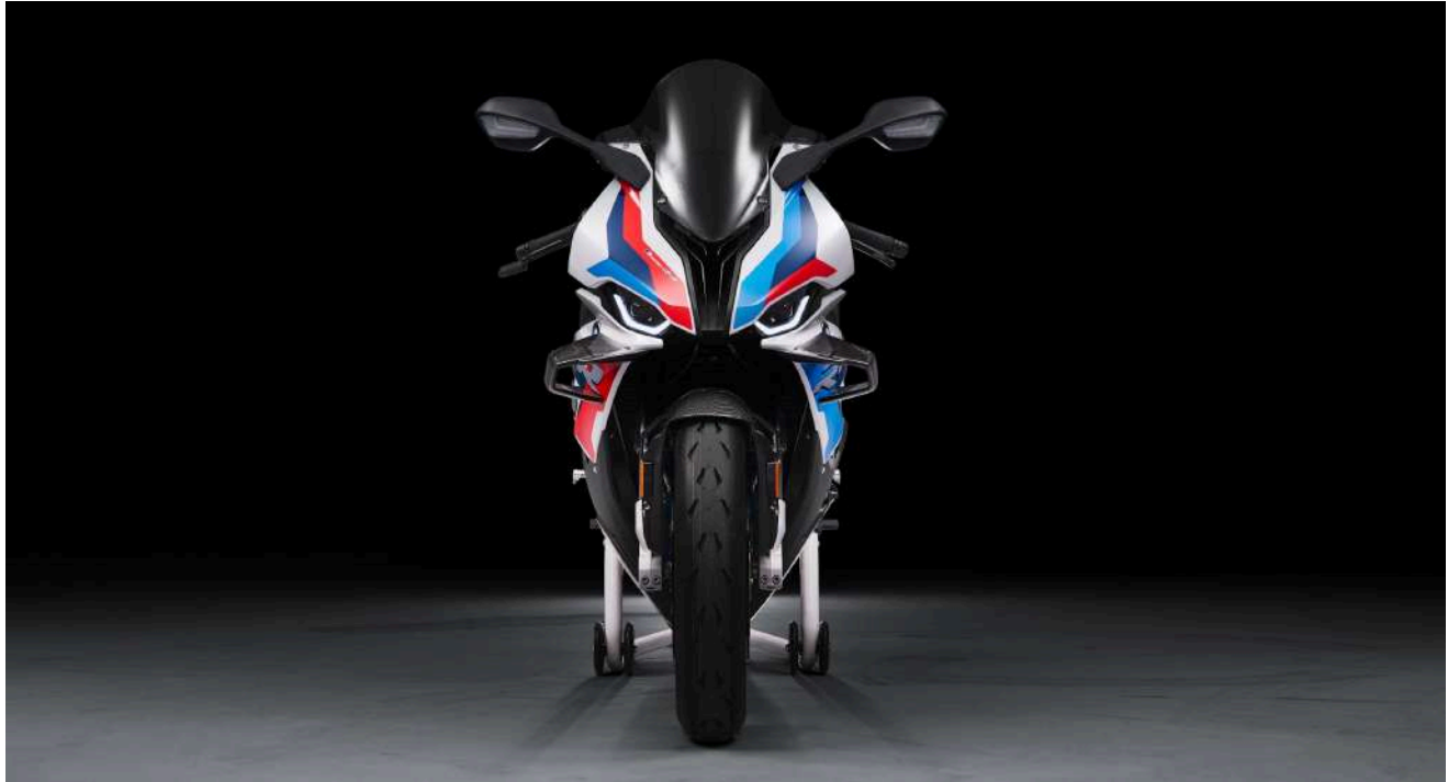
BMW M 1000 RR