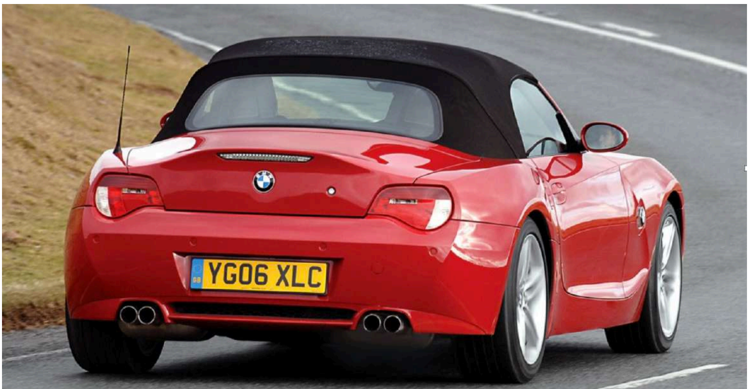
BMW Z4 M Roadster E85 343 HP's