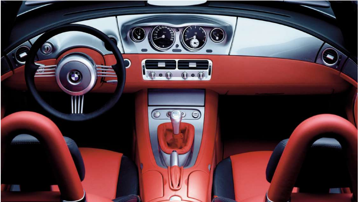
BMW Z8 Roadster E52 395 HP's Painel