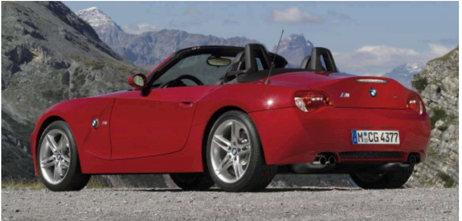
BMW Z4 M Roadster E85 343 HP's