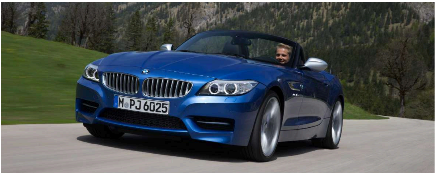
BMW Z4 E89 M3.5IS 3.0 LN54 382 HP's Estoril Blue

A versão Euro do motor Z4 MsDrive35is tinha 335 HP e a versão americana 382 HP.