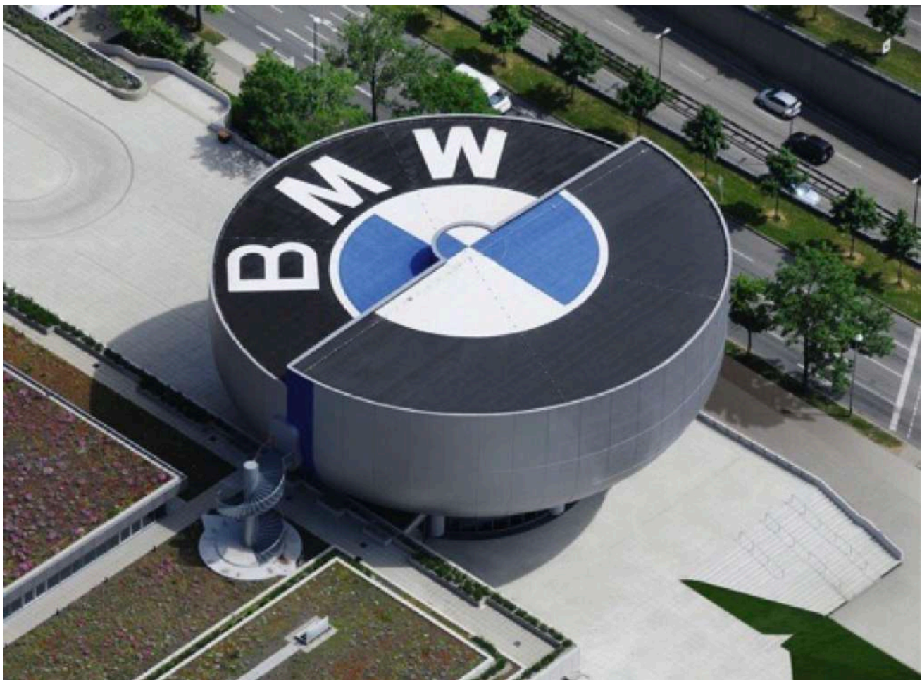
BMW Museum - Vista Aérea

Em dezembro de 2001, após discussões aprofundadas, o Conselho do BMW Group votou a favor do conceito arquitetônico de Coop Himmelb. O excelente conceito BMW Welt é amplamente caracterizado pela estrutura única do telhado e o chamado Cone Duplo.