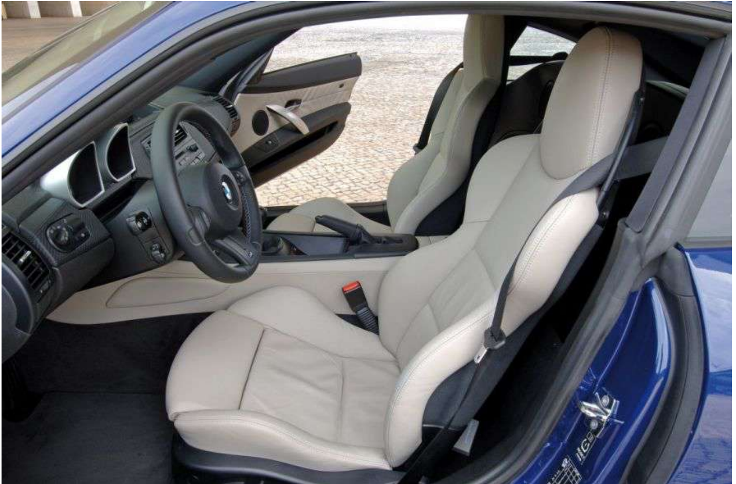
BMW Z4 M Coupe E86 343 HP's Interior