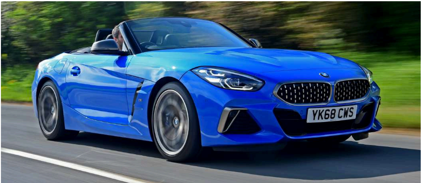
BMW Z4 G29 M40i 382 HP's Misano Blue