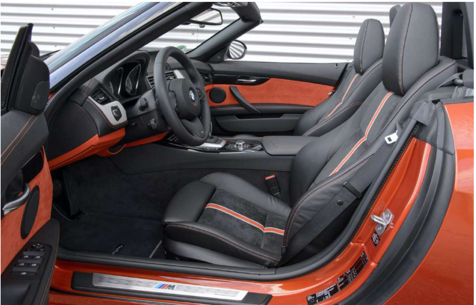
BMW Z4 E89 M3.5IS 3.0 LN54 382 HP's Valencia Orange Interior