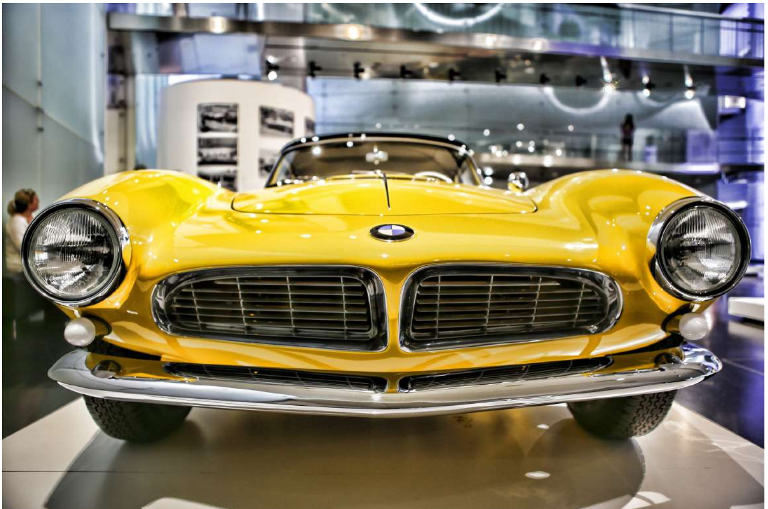
BMW Museum - Vista Interna - BMW 507 V8 Amarela

O conceito se referia a uma ideia do arquiteto Prof. Karl Schwazer, criador do Museu BMW em 1973. Ele definiu a estrutura interna do edifício redondo como uma continuação da estrada em um espaço fechado.