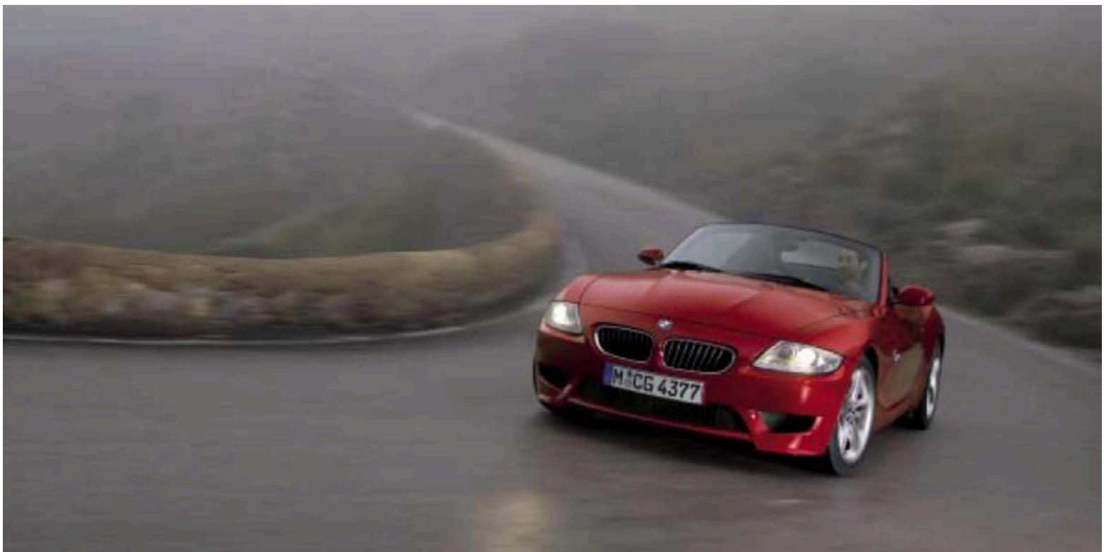
BMW Z4 M Roadster E85

O modelo M, o Z4 M, é movido pelo motor de seis cilindros em linha S54 de 343 HP's.