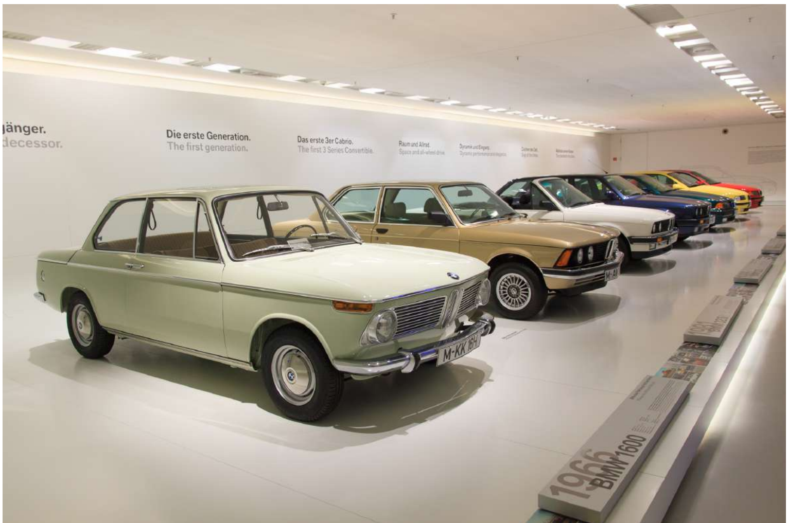
BMW Museum - Vista Interna - BMW 3 Series Evolução

A peça central do Museu BMW é a exposição permanente de 4.000 m 2 contendo cerca de 110 peças. Ele é acompanhado por exposições temporárias dedicadas a temas específicos e as questões candentes do dia. Estas exposições criam experiências, alimentam o fascínio e utilizam a informação para destacar especialmente o tema da mobilidade pessoal, explorar aspectos da história da empresa com maior profundidade e apresentar as marcas individuais do Grupo.