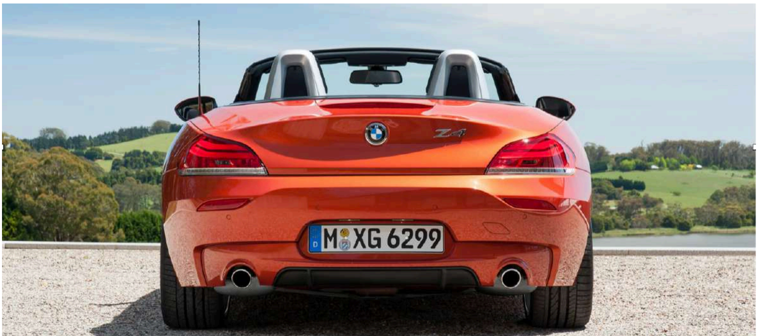
BMW Z4 E89 M3.5iS 3.0 LN54 382 HP's Valencia Orange