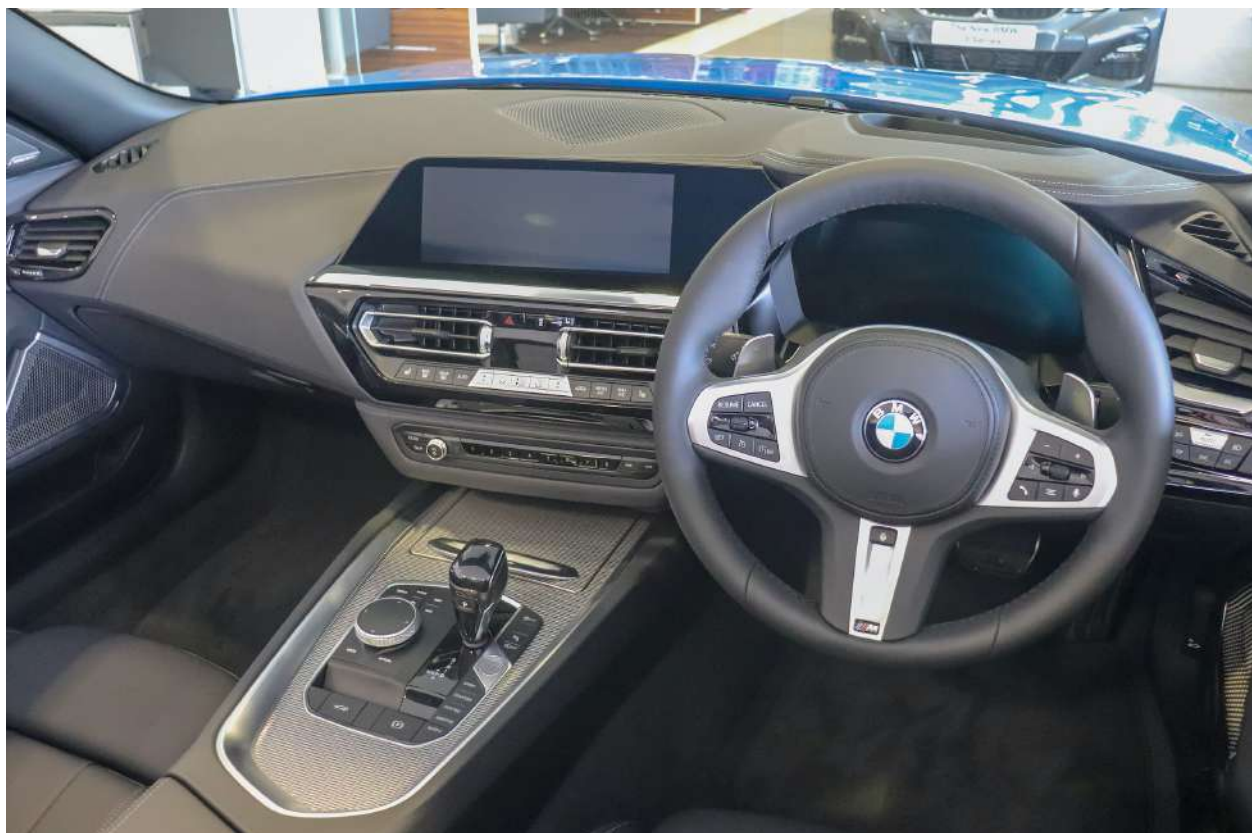
BMW Z4 G29 M40i 382 HP's Misano Blue Interior