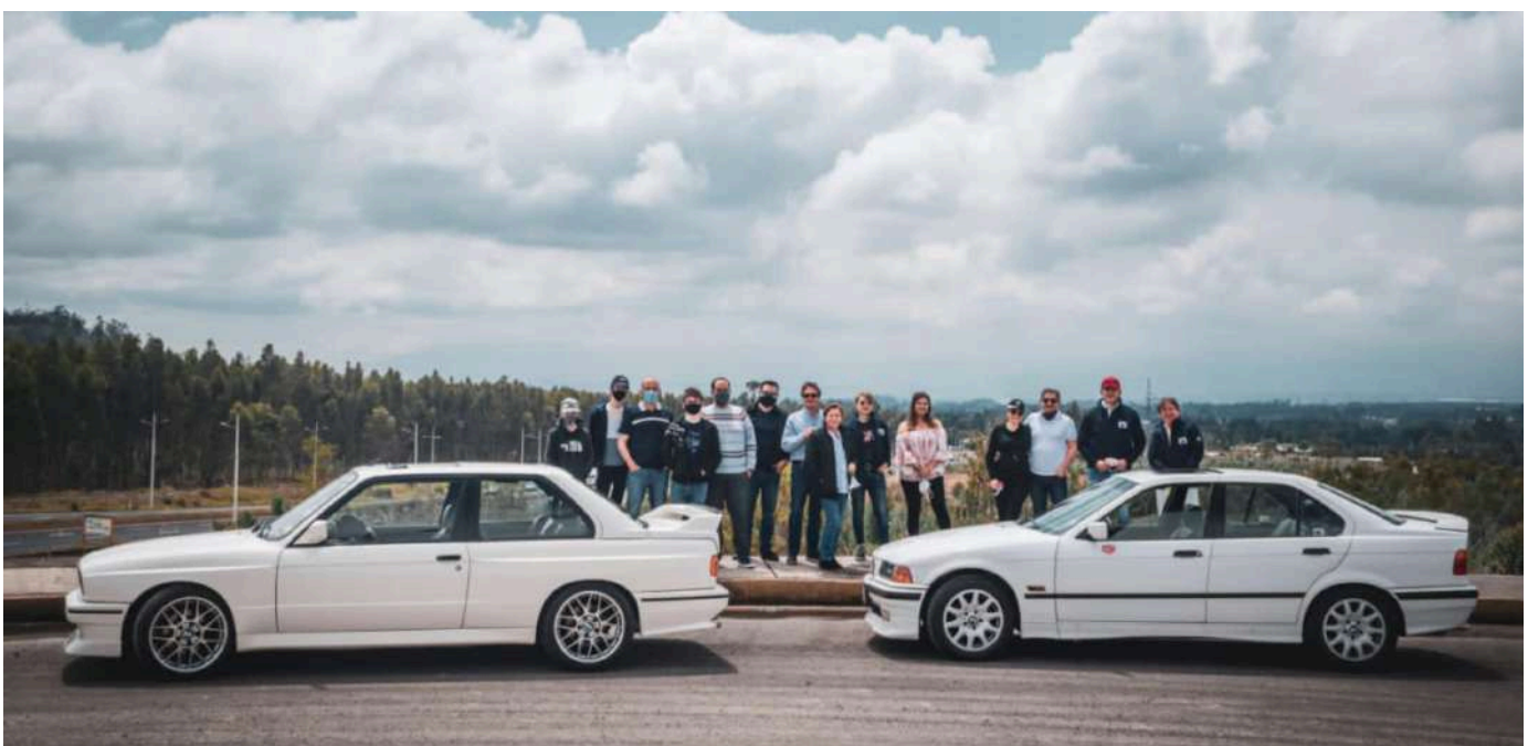
BMW Auto Club Ecuador - Encontro Dezembro 2020

Em agosto de 2016 na Convenção da Costa Rica, o BMW Auto Club Equador foi formalmente reconhecido como Clube de Carros Oficial BMW, pela BMWCLAF - BMW Clubs Federação Latinoamericana e BCIC - BMW Clubs Conselho International.