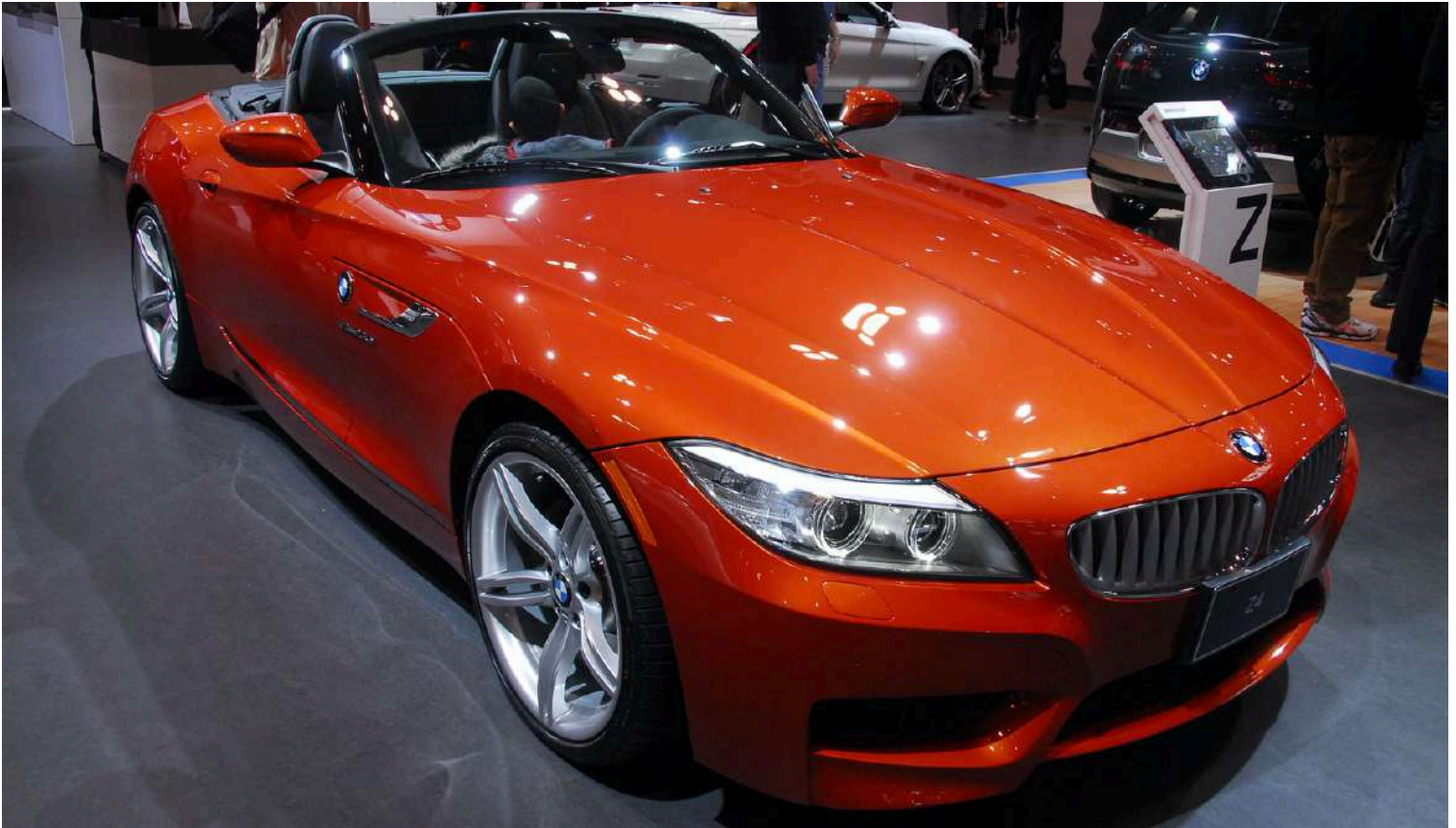
BMW Z4 E89 M3.5iS 3.0 LN54 382 HP's Valencia Orange