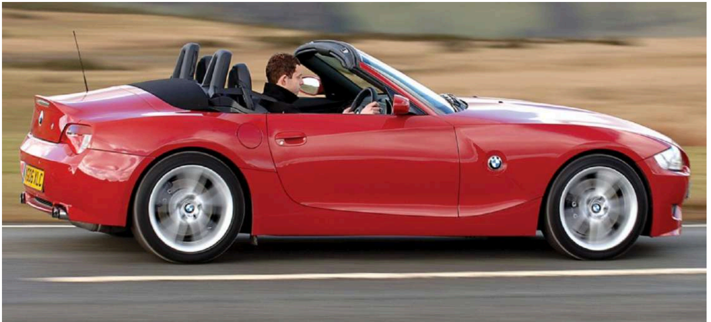
BMW Z4 M Roadster E85 343 HP's