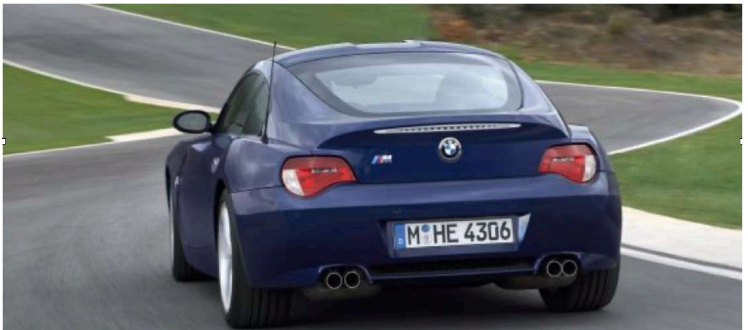
BMW Z4 M Coupe E86 343 HP's