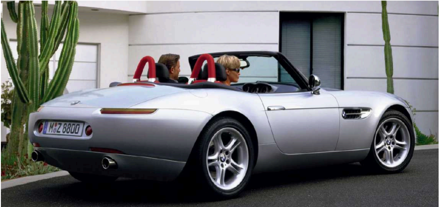
BMW Z8 Roadster E52 395 HP's