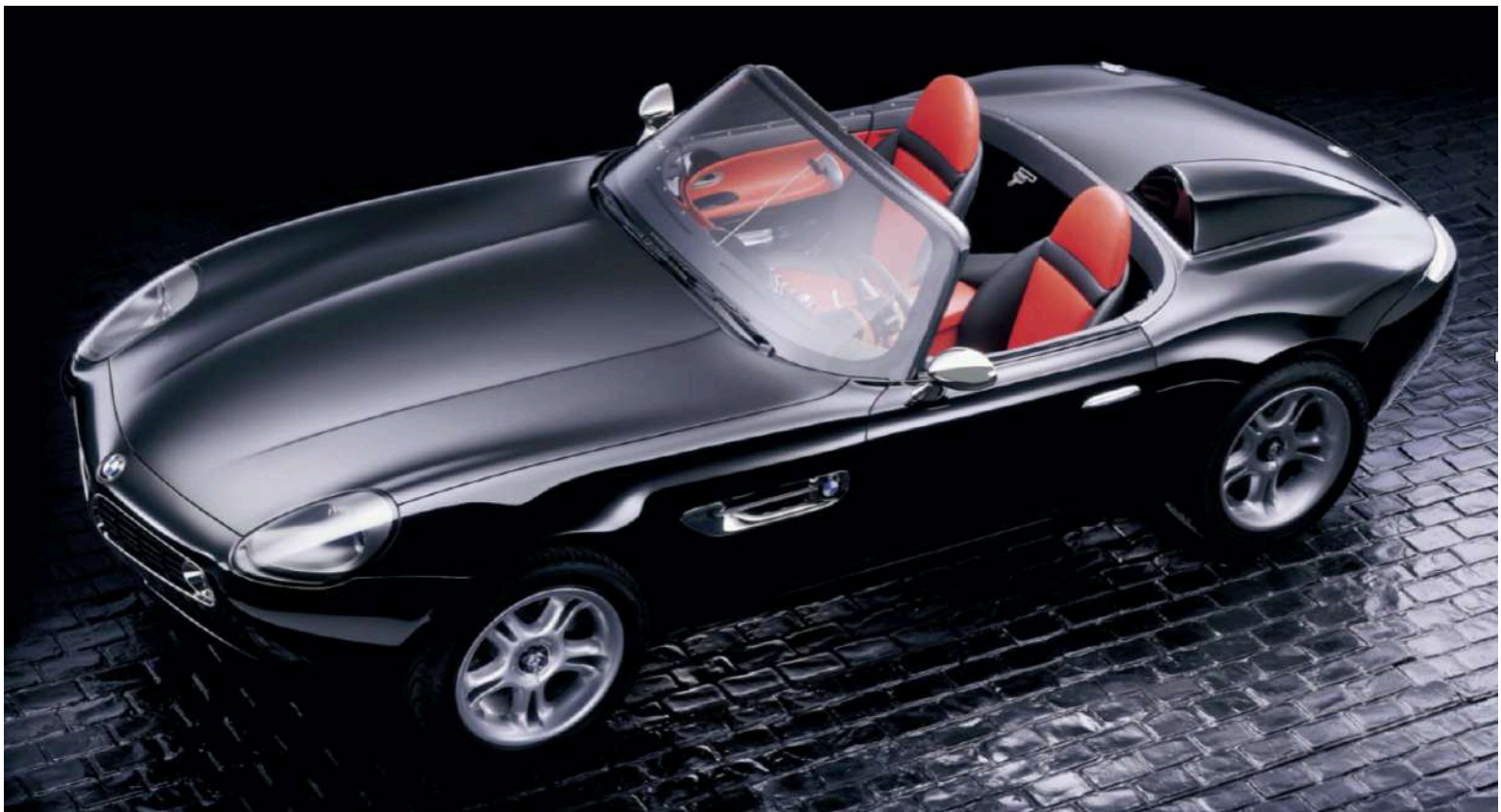
BMW Z8 Roadster E52 - Conceito Z07

Apesar dessas mudanças, ele permaneceu muito fiel ao protótipo. Os indicadores de mudança de direção foram integrados nas aberturas de ventilação laterais para que fiquem invisíveis quando desligados. Ele mantém as rodas de cinco raios do protótipo, embora sem a única porca.