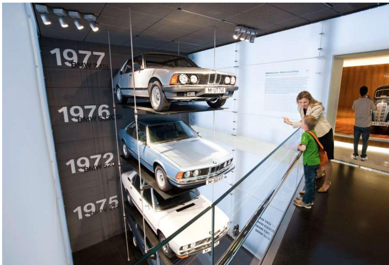
BMW Museum - Vista Interna - BMW Series 3 E21, 5 E12, 6 E24 e 7 E23

Para o mundo exterior, ele aparece como uma enorme escultura de concreto autocontida e seu interior é dominado pelo caráter de um espaço aberto, enquanto a arquitetura do prédio baixo é mais urbana por natureza. As duas seções do edifício, os prédios redondos e os prédios baixos, são conectados por uma rampa para visitantes, que leva os visitantes às 25 áreas de exposição.