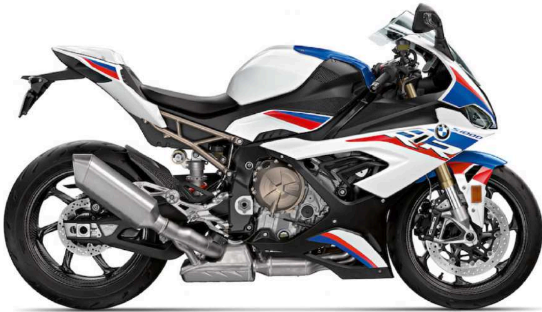
BMW M 1000 RR