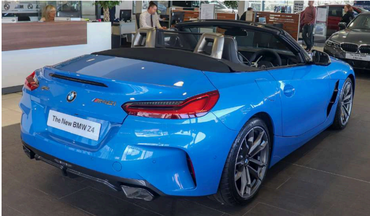
BMW Z4 G29 M40i 382 HP's Misano Blue