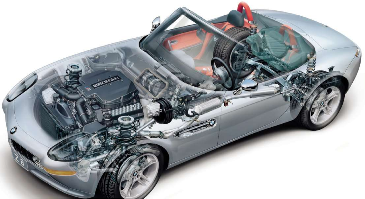
BMW Z8 Roadster E52 395 HP's - Raio X