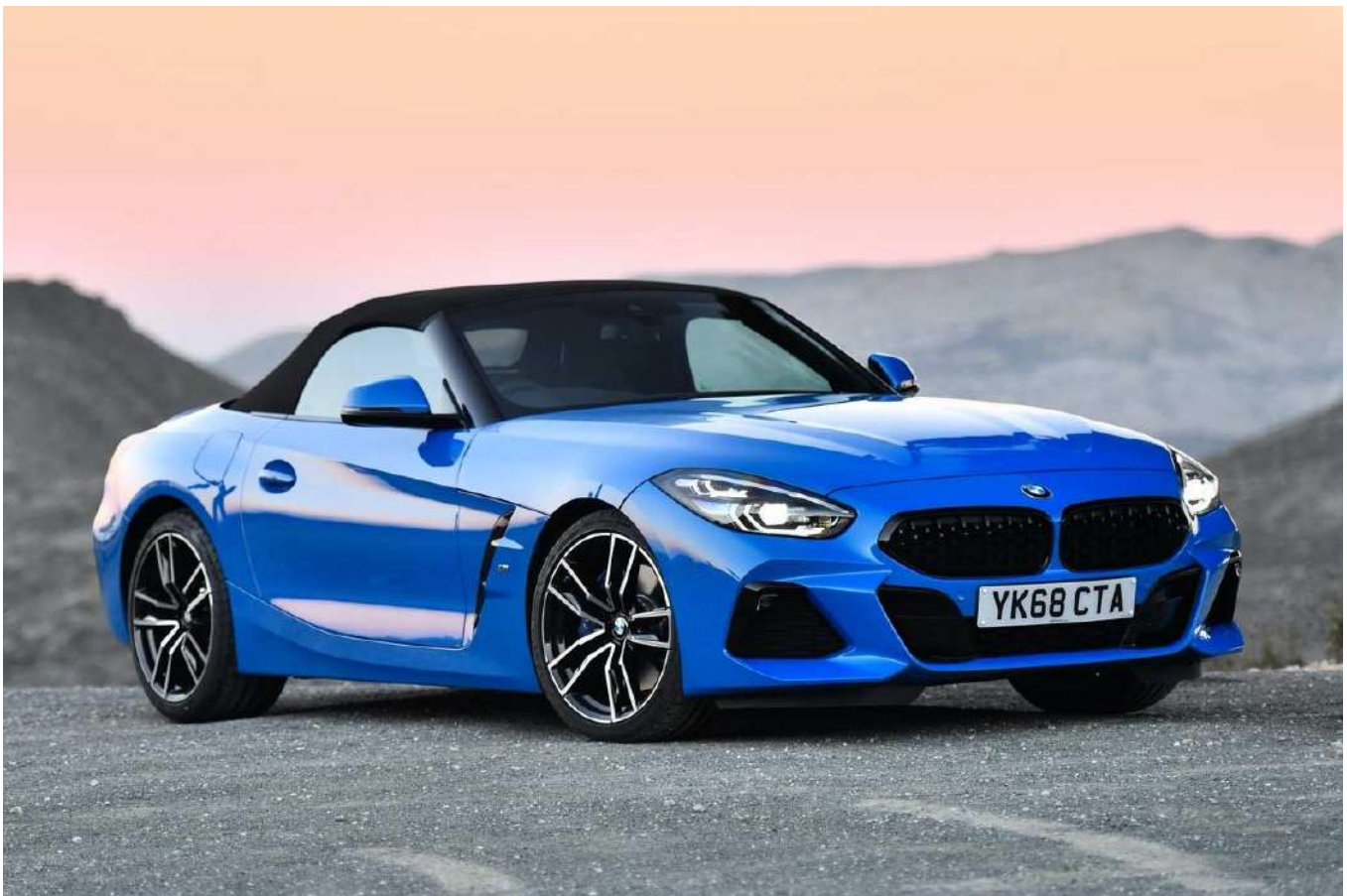
BMW Z4 G29 M40i 382 HP's Misano Blue