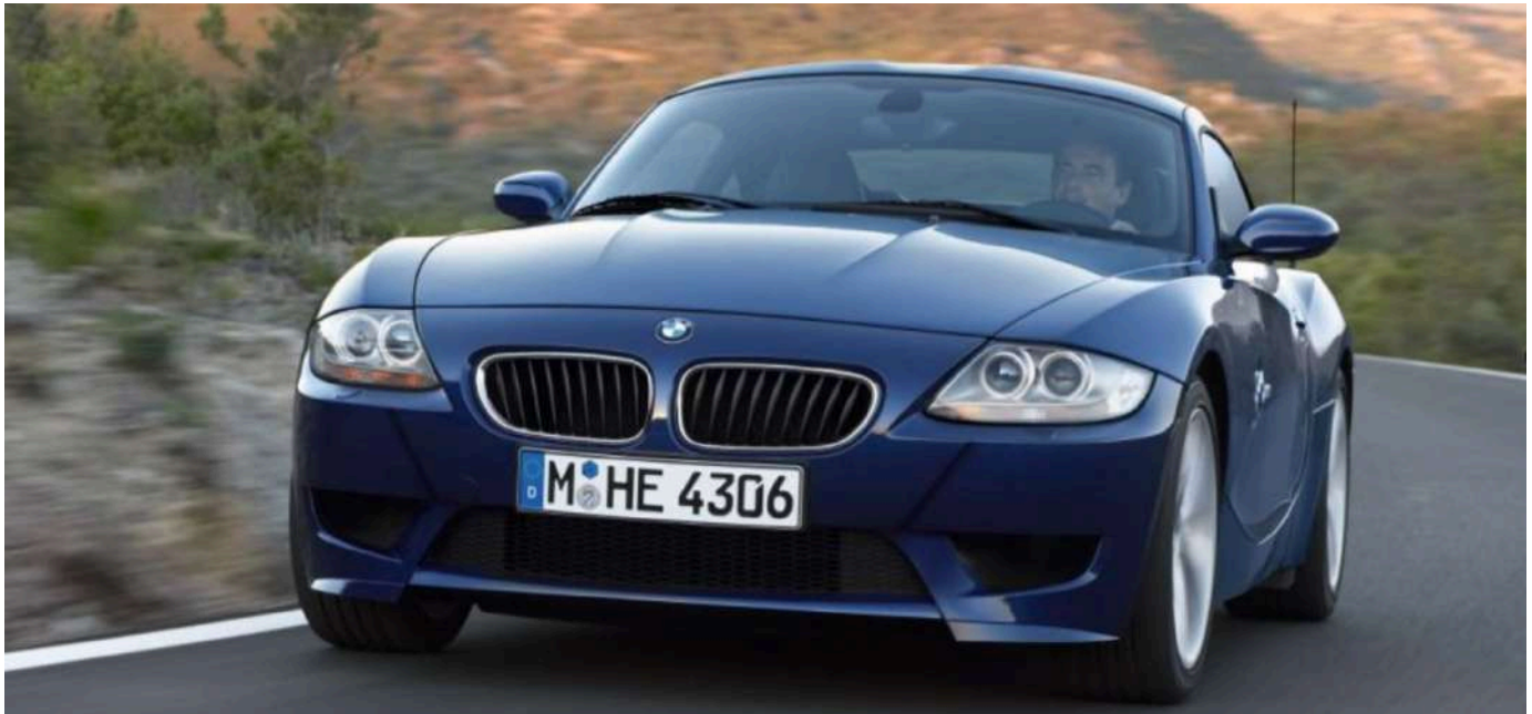
BMW Z4 M Coupe E86 343 HP's