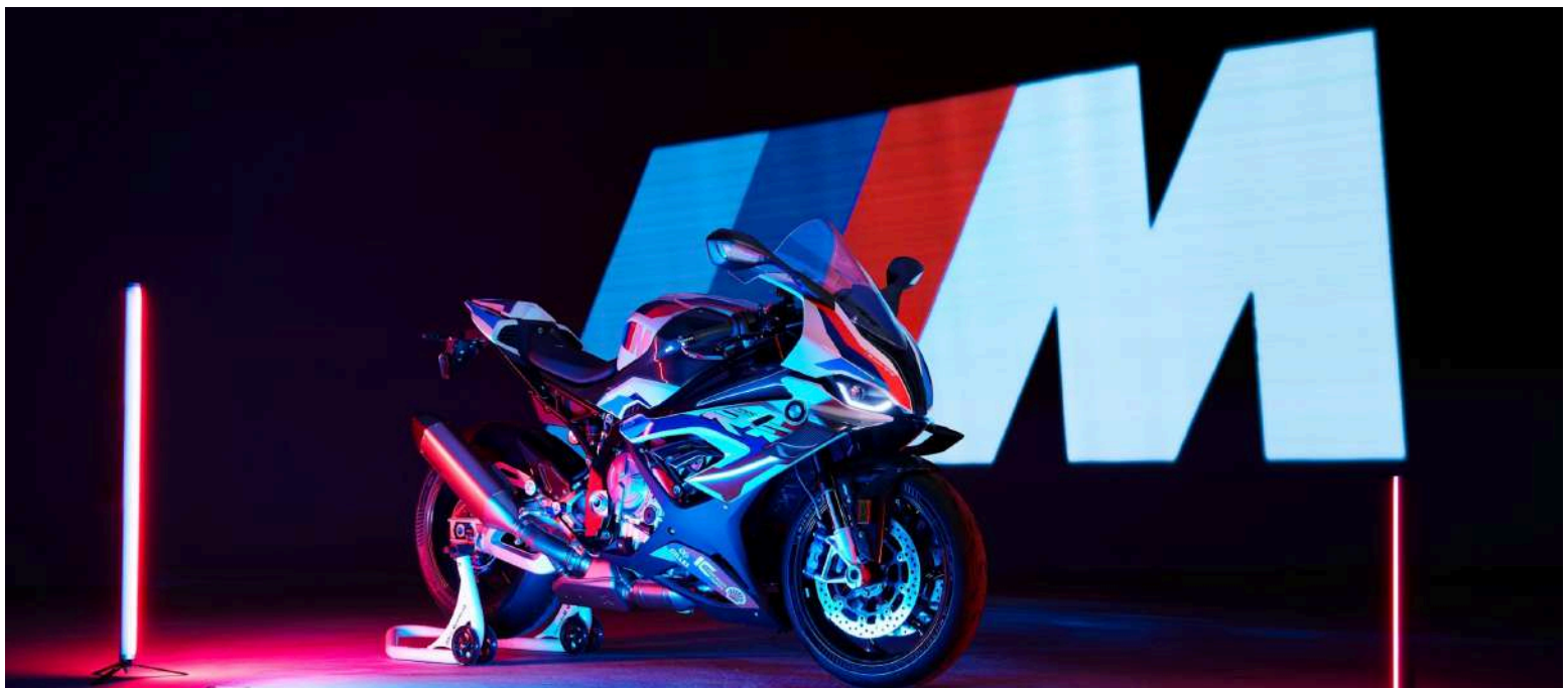
BMW M 1000 RR

Com uma potência de motor de 156 kW (212 CV), um peso vazio do veículo DIN de somente 192 kg, uma suspensão e aerodinâmica redesenhadas para um rendimento máximo na pista, a nova M RR cumpre com as principais expectativas no segmento superior de Superbikes.