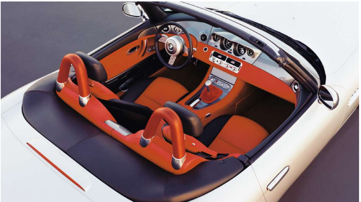
BMW Z8 Roadster E52 395 HP's Interior