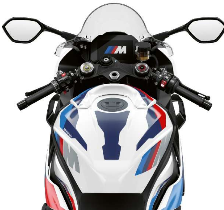
BMW M 1000 RR