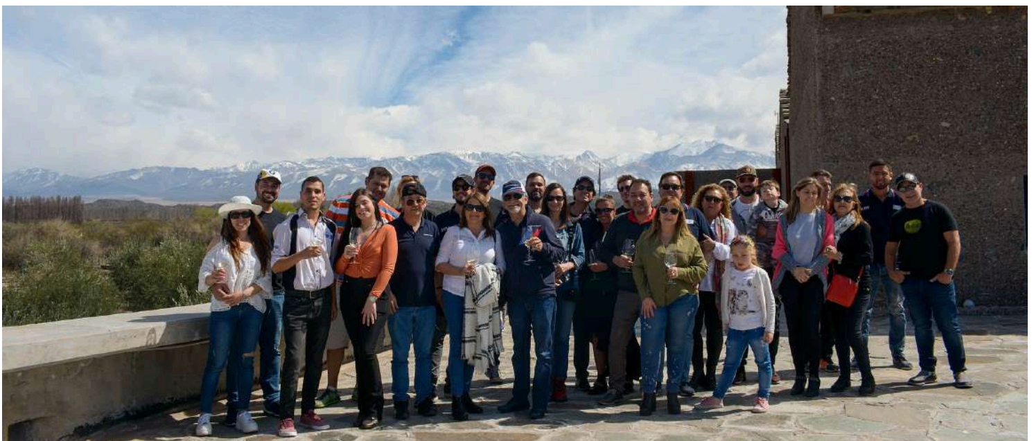
BMW Auto Club Mendoza - Encontro Setembro 2019

Planejar reuniões, caminhadas, passeios e outros eventos.