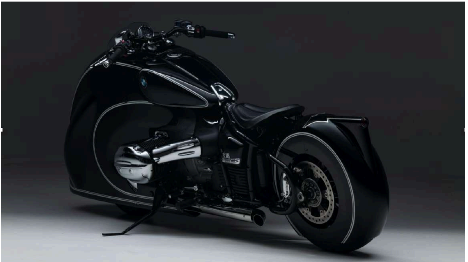
BMW R18 Custom Bike