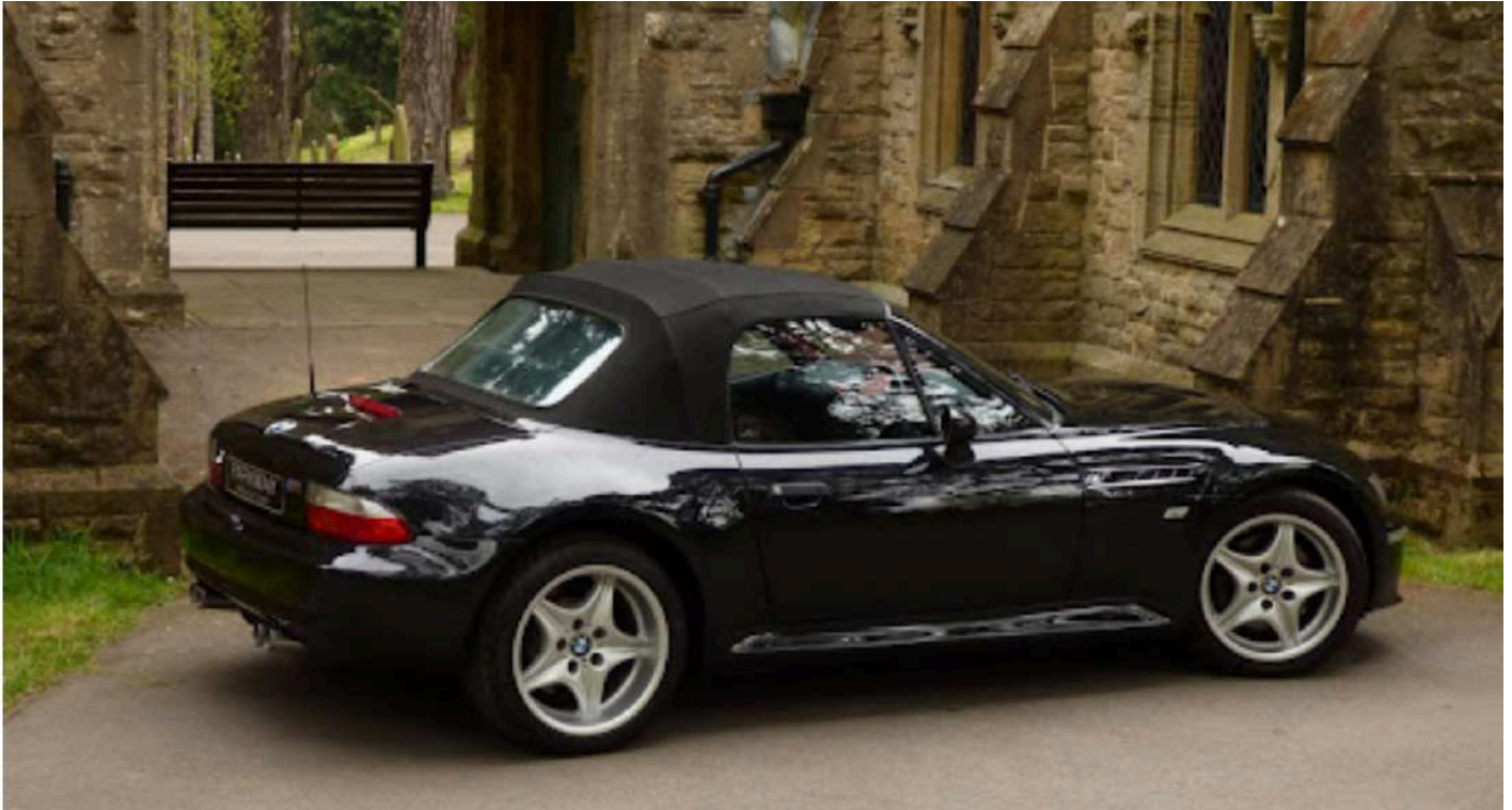
BMW M Roadster E36/7 i6