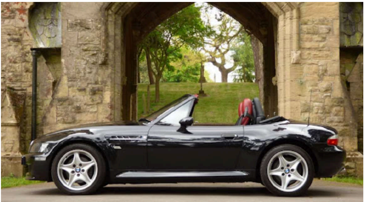
BMW Z3 M Roadster E36/7 i6