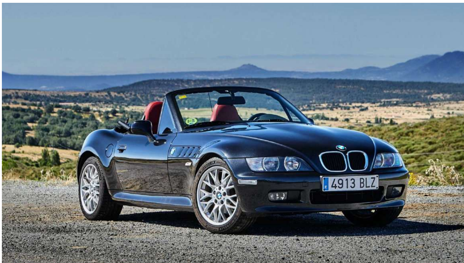
BMW Z3 3.0 E36/7 i6

Em 2021 comemoramos 25 anos de seu lançamento, já é um verdadeiro clássico esportivo.