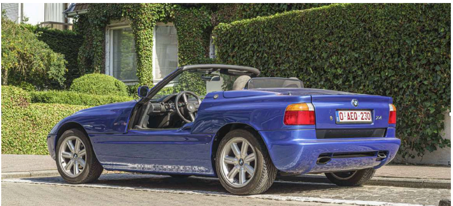
BMW Z1 E30/Z i6 - Portas abaixo