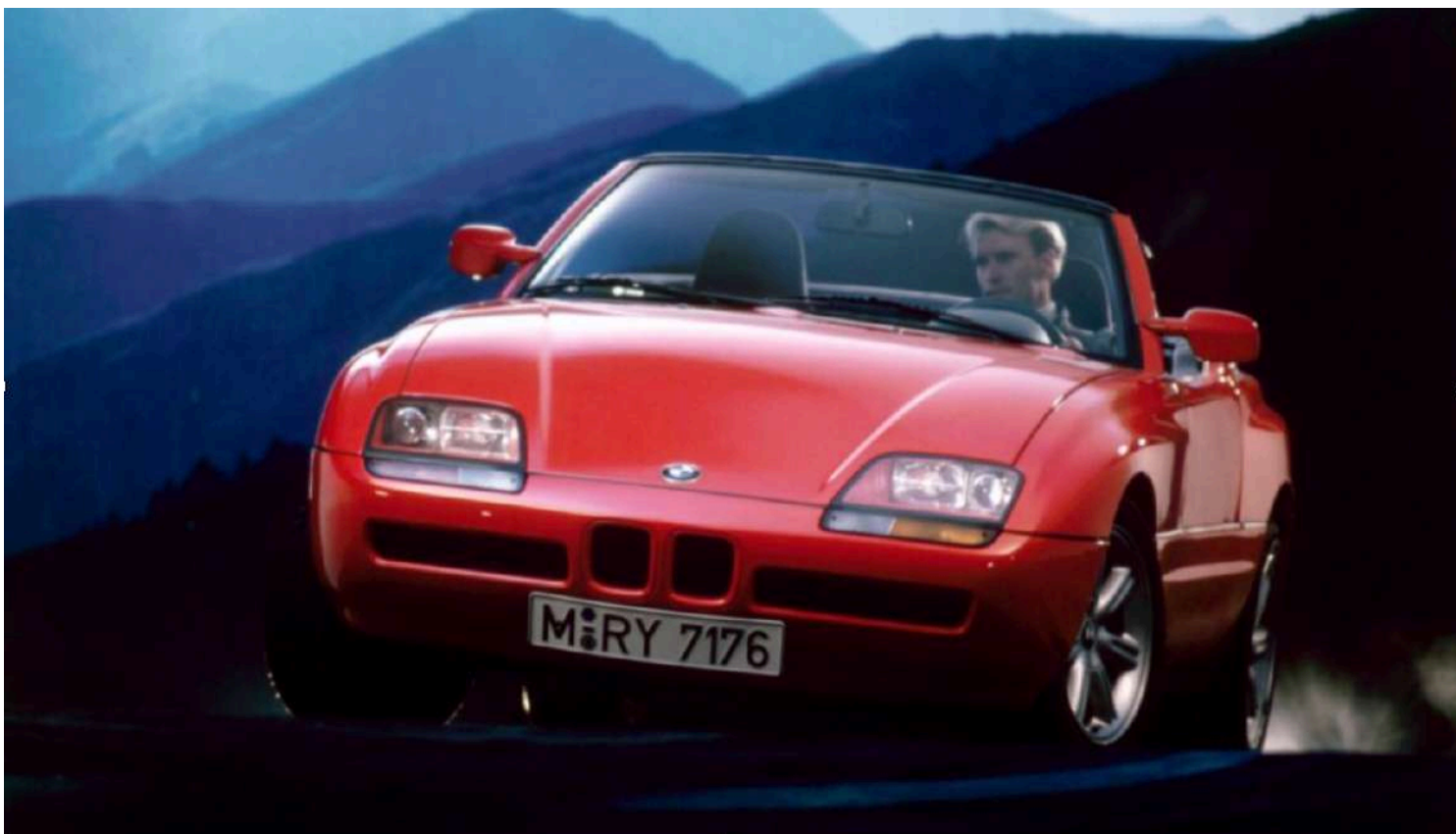
BMW Z1 E30/Z i6 - Catálogo de vendas