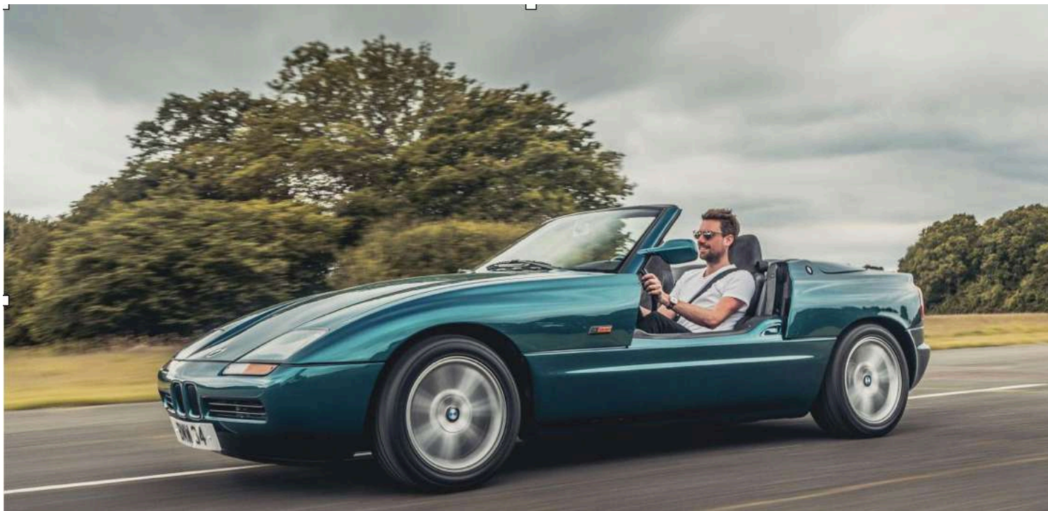
BMW Z1 E30/Z i6 - Portas abaixo