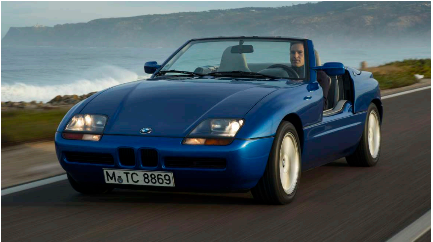
BMW Z1 E30/Z i6 - Portas abaixo