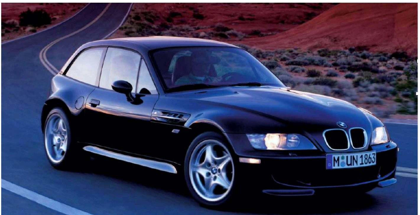
BMW M Cupê E36/8 i6