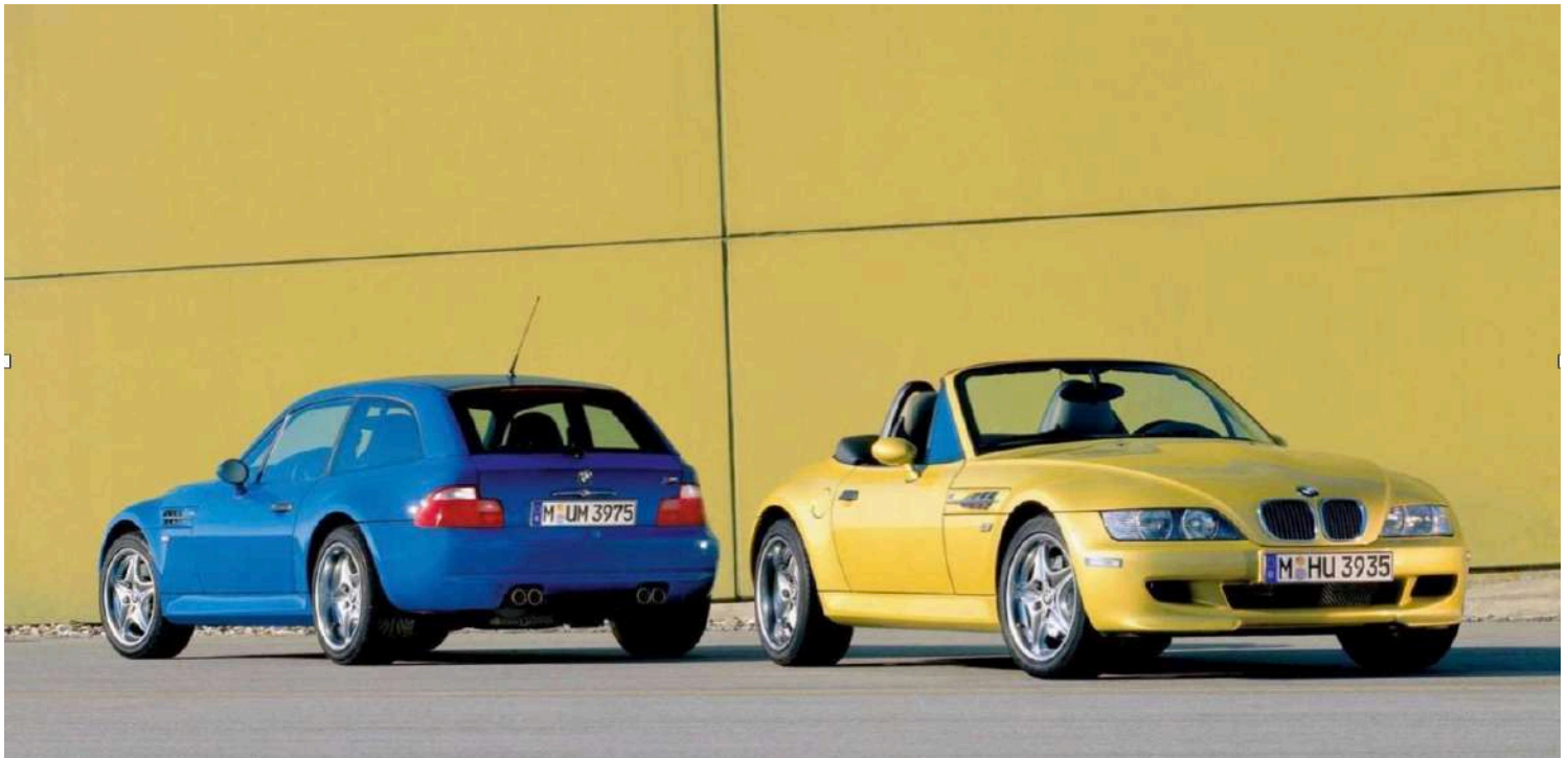
BMW Z3 M Cupê E36/7 i6 e BMW Z3 M Roadster E36/8 i6