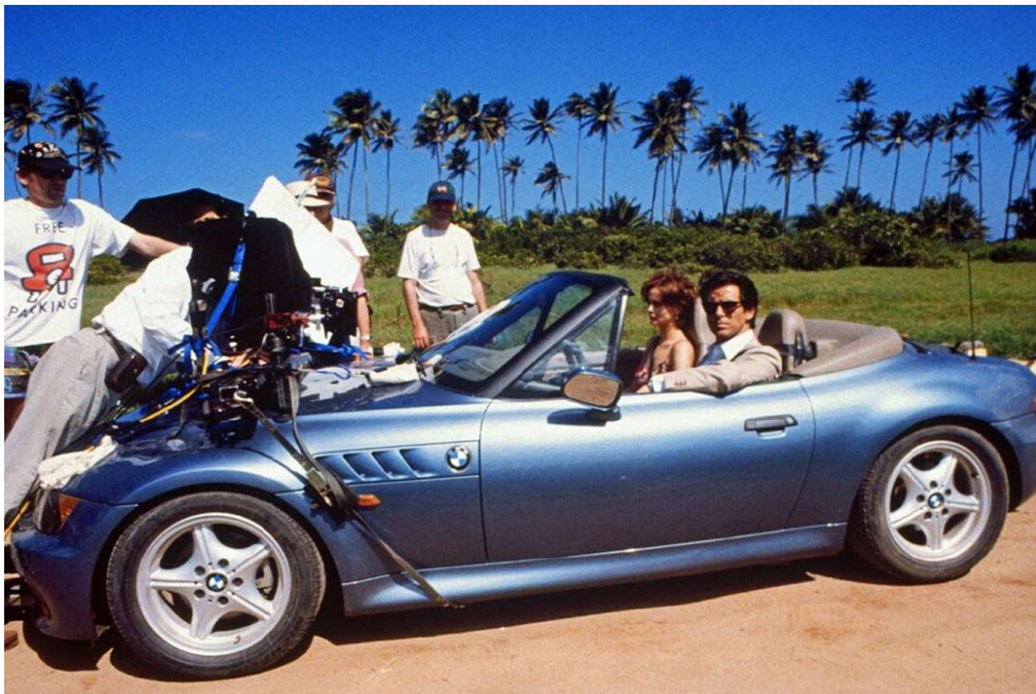
BMW Z3 E36/7 i4 - James Bond 007

O Cupê foi fabricado a partir de janeiro de 1998 e seu chassi era 2,7 vezes mais rígido que o Roadster.