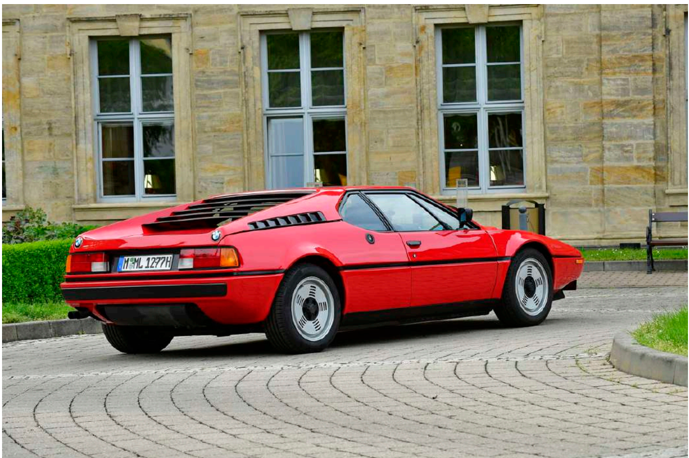
BMW M1 E26

O BMWCCB - BMW Car Club Brasil, foi fundado em novembro de 1999, em São Paulo, por entusiastas de automóveis da marca alemã BMW, criando inicialmente a divisão de Automóveis dentro do já existente BMW Clube do Brasil, atualmente BMW Motorrad Clube Brasil.