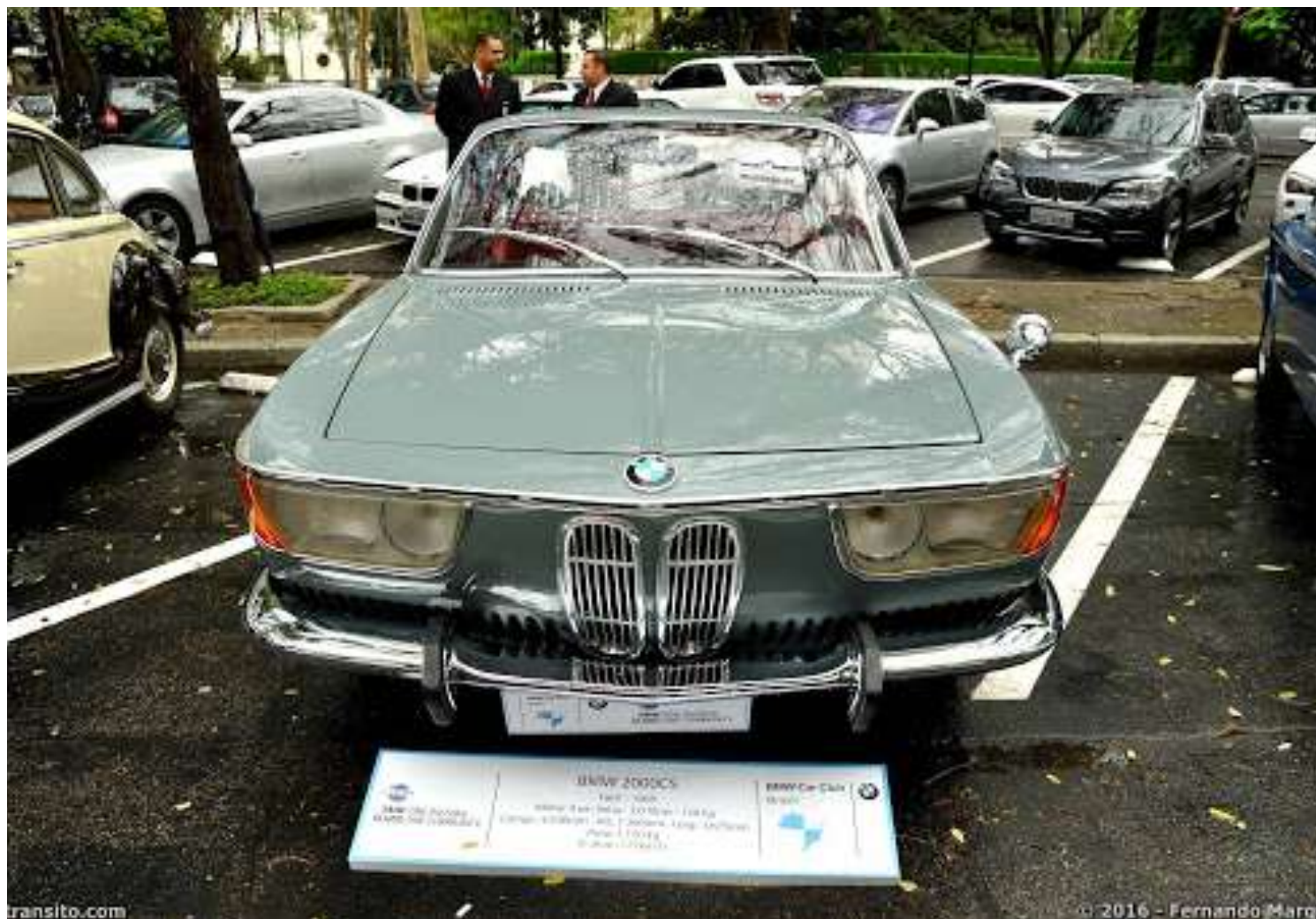
Exposição BMW 100 Anos - Shopping Iguatemi São Paulo - Set 2016

Em 2019, o BMWCCB recebeu uma nova e atualizada Certificação da BMWCLAF - BMW Clubs Latin America Federation, reiterando sua posição como o único Clube BMW de Automóveis Oficial no Brasil.