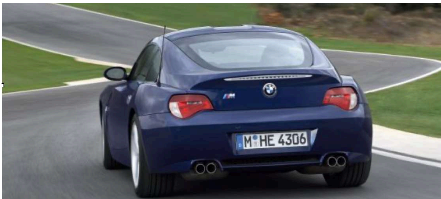
BMW Z4 M Coupe E86 i6 343 HP