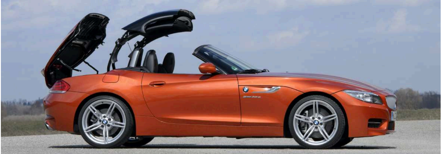
BMW Z4 E89 M3.5IS i6 335 HP Valencia Orange