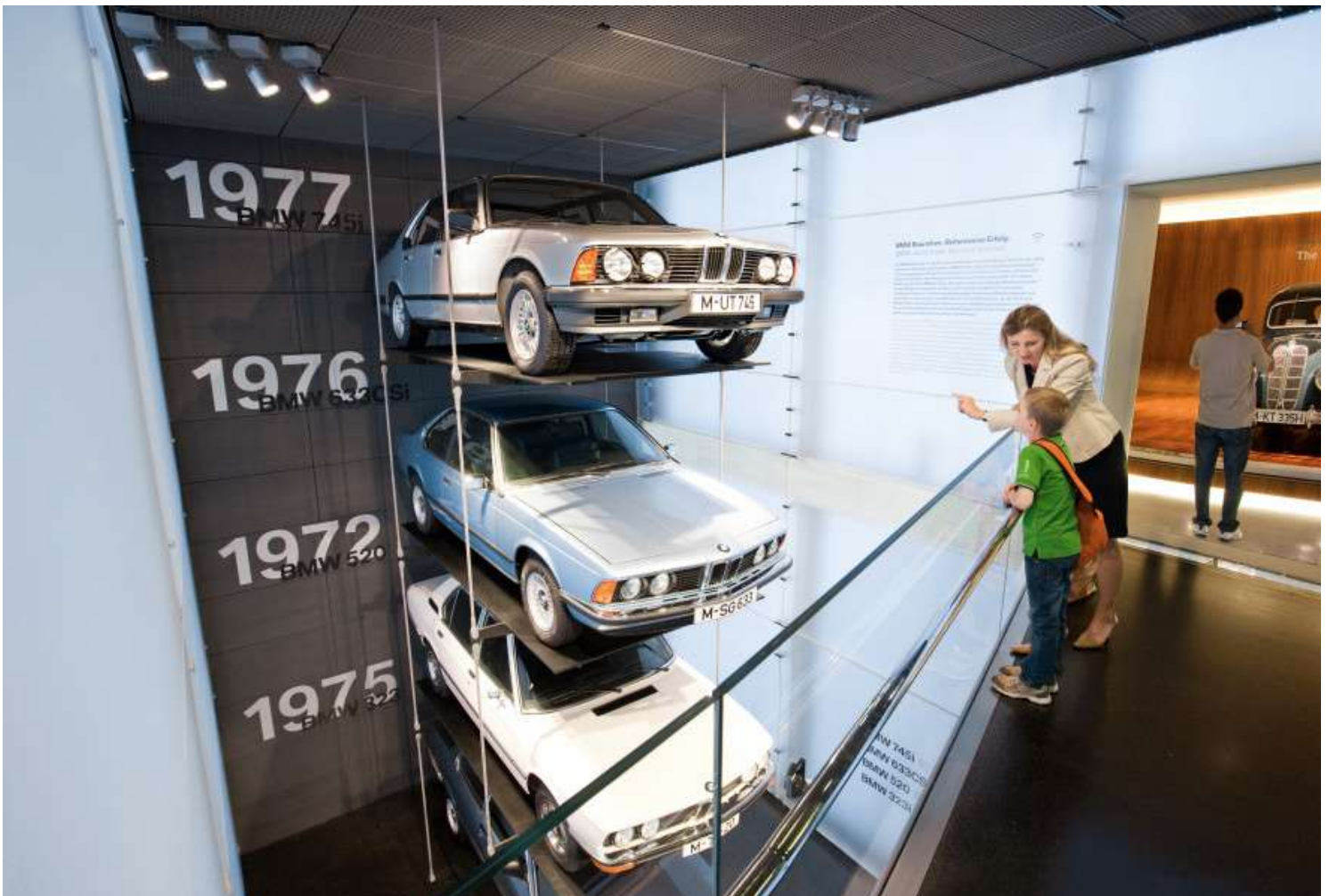
BMW Museum - Vista Interna - BMW Series 3 E21, 5 E12, 6 E24 e 7 E23

Para o mundo exterior, ele aparece como uma enorme escultura de concreto autocontida e seu interior é dominado pelo caráter de um espaço aberto, enquanto a arquitetura do prédio baixo é mais urbana por natureza. As duas seções do edifício, os prédios redondos e os prédios baixos, são conectados por uma rampa para visitantes, que leva os visitantes às 25 áreas de exposição.