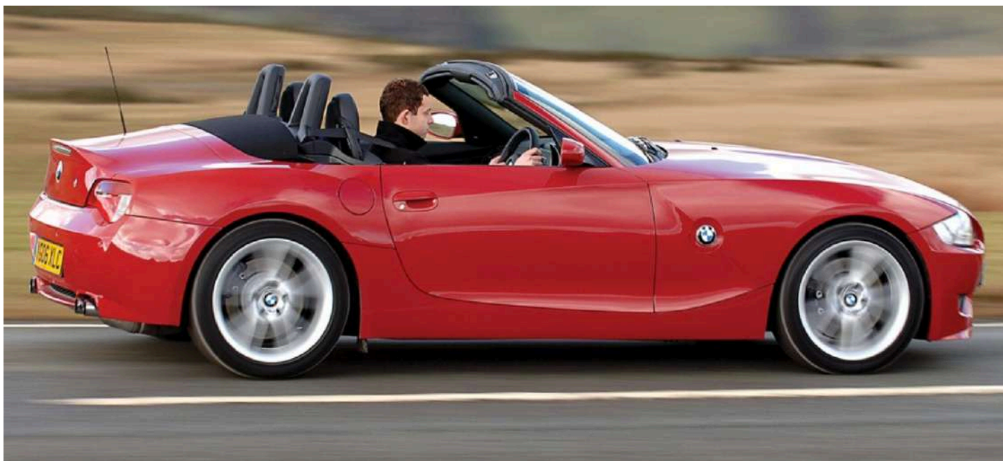
BMW Z4 M Roadster E85 i6 343 HP